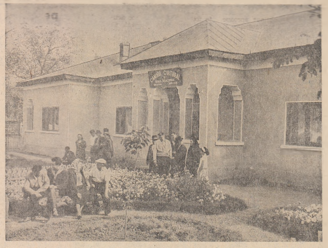
Caminul cultural din comuna Gologanu, raionul Poșcani, regiunea Galați.

ELISABETHVILLE 17 (Agerpres). Agențiile occidentale de presă anunță că între forțele O.N.U. și autoritățile katangheze s-a produs un nou conflict în urma faptului că acordul „definitiv” asupra încetării focului a fost rupt la numai patru zile după încheierea lui. Schimbul de prizonieri prevăzut prin acest acord nu a avut loc.