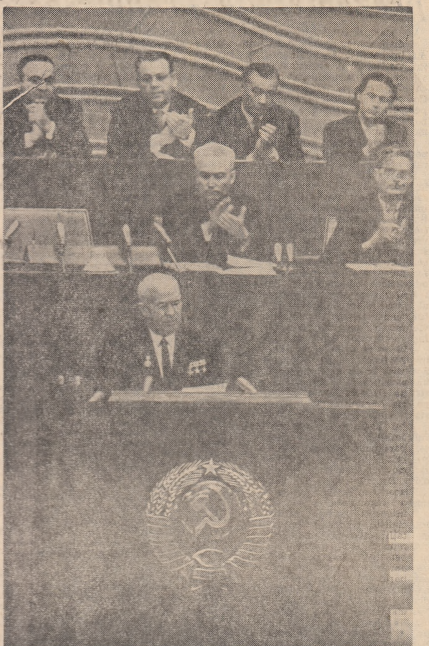
N. S. Hrușciov prezintă raportul.