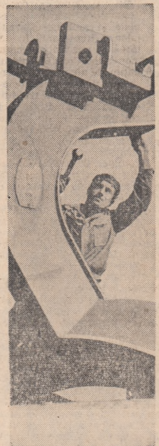
Trustul de utilaj greu din Capitală asigură cu utilaje grele (macarale, excavatoare, scutere, compresoare etc.) șantierele de construcții din Capitală și din țară.

Lucrările de desecări care au început în Dobrogea odată cu formarea primelor gospodării colective au fost extinse an de an, redîndu-se pînă în prezent pentru culturile agricole 23.900 hectare. În prezent în această regiune o suprafață de 20.300 hectare este irigată. Prin irigare, unitățile agricole socialiste din regiune obțin de pe aceeași suprafață recolte de 2-3 ori mai mari.