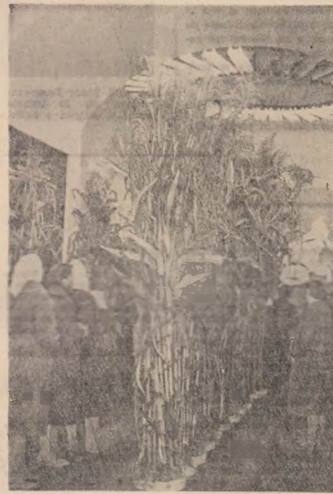
La Expoziția Uniunii a realizărilor economiei naționale a U.R.S.S., a început expunerea porumbului cultivat de sovhozuri și colhozuri anul acesta.