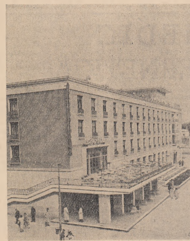
Centrul orașului Galați.