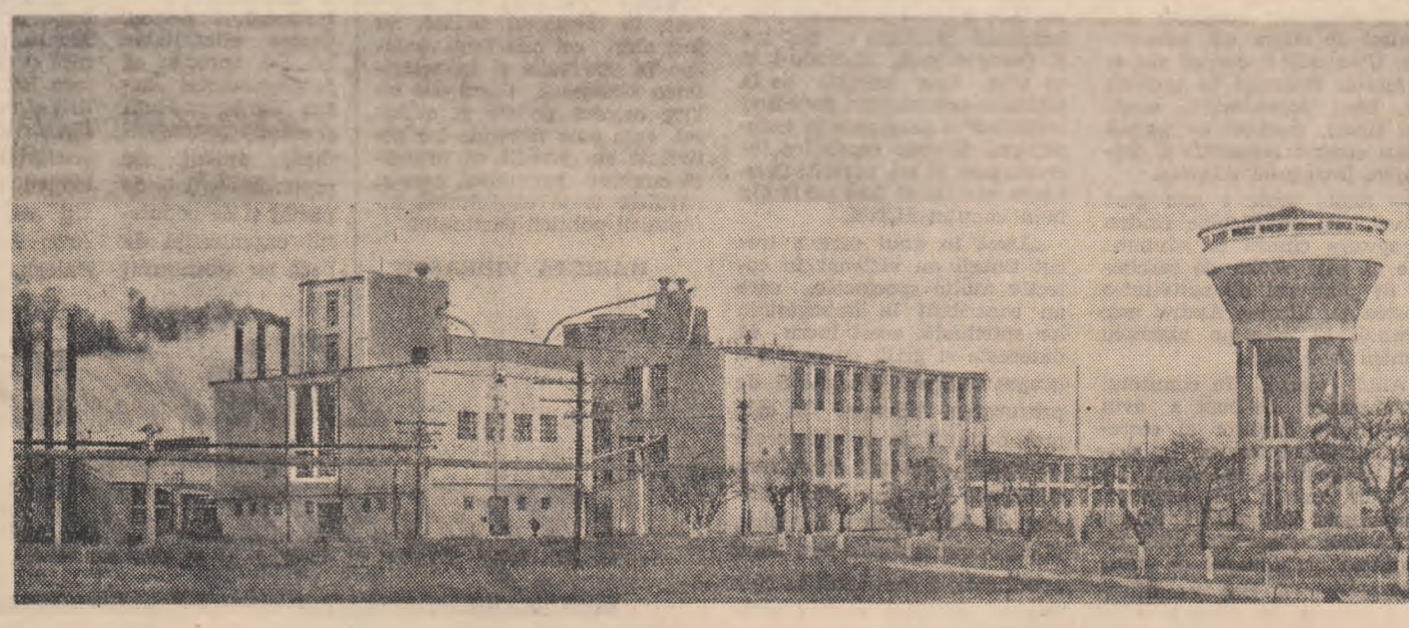
Exteriorul Fabricii de semiceluloză din paie de la Palas-Constanța

Înscrierile candidaților se fac la secretariatele facultății-