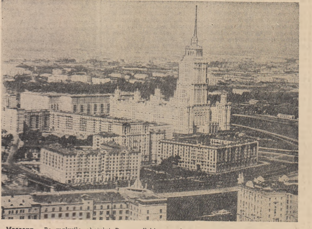
Moscova: Pe malurile cheului Dorogomilski se înalță numeroase blocuri nou construite pentru oamenii muncii.

Corespondenții din Ankara ai agențiilor occidentale de presă relatează că, întrucît nici un partid nu a reușit să obțină majoritatea absolută, în cursul săptămînii următoare se vor începe tratative pentru alcătuirea unui guvern de coaliție.