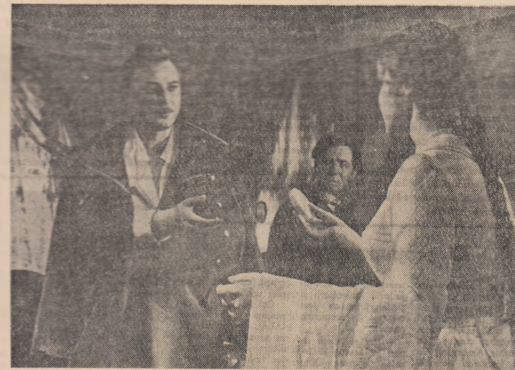
O scenă din film

unde trebuie să participe ca jurat. În același timp, o femeie tină și frumoasă, dar avînd acea privire fixă și indiferentă a oamenilor care nu mai cred în nimic și nu mai așteaptă nimic de viață, pășeste prin băltoace, îndreptîndu-se, escortată de doi soldați,