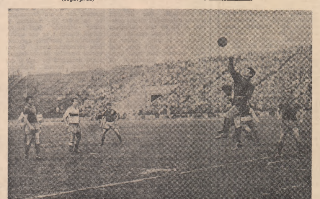
O fază din meciul de fotbal: Rapid-C.C.A. disputat duminică pe Stadionul „23 August”