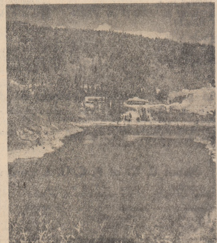
Vedere parțială a lacului de acumulare al hidrocentralii Sădu V.