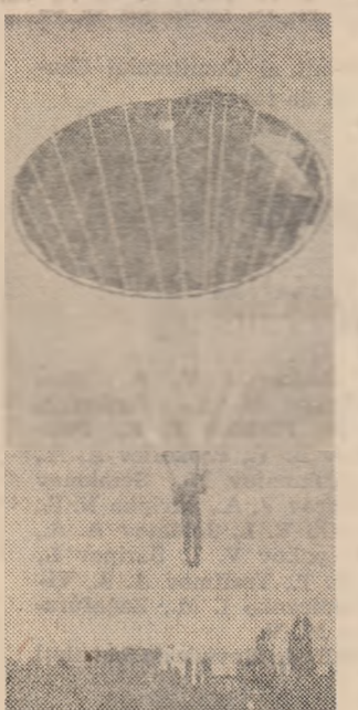
Exerciții cu parasuta în parcul „23 August” din Capitală