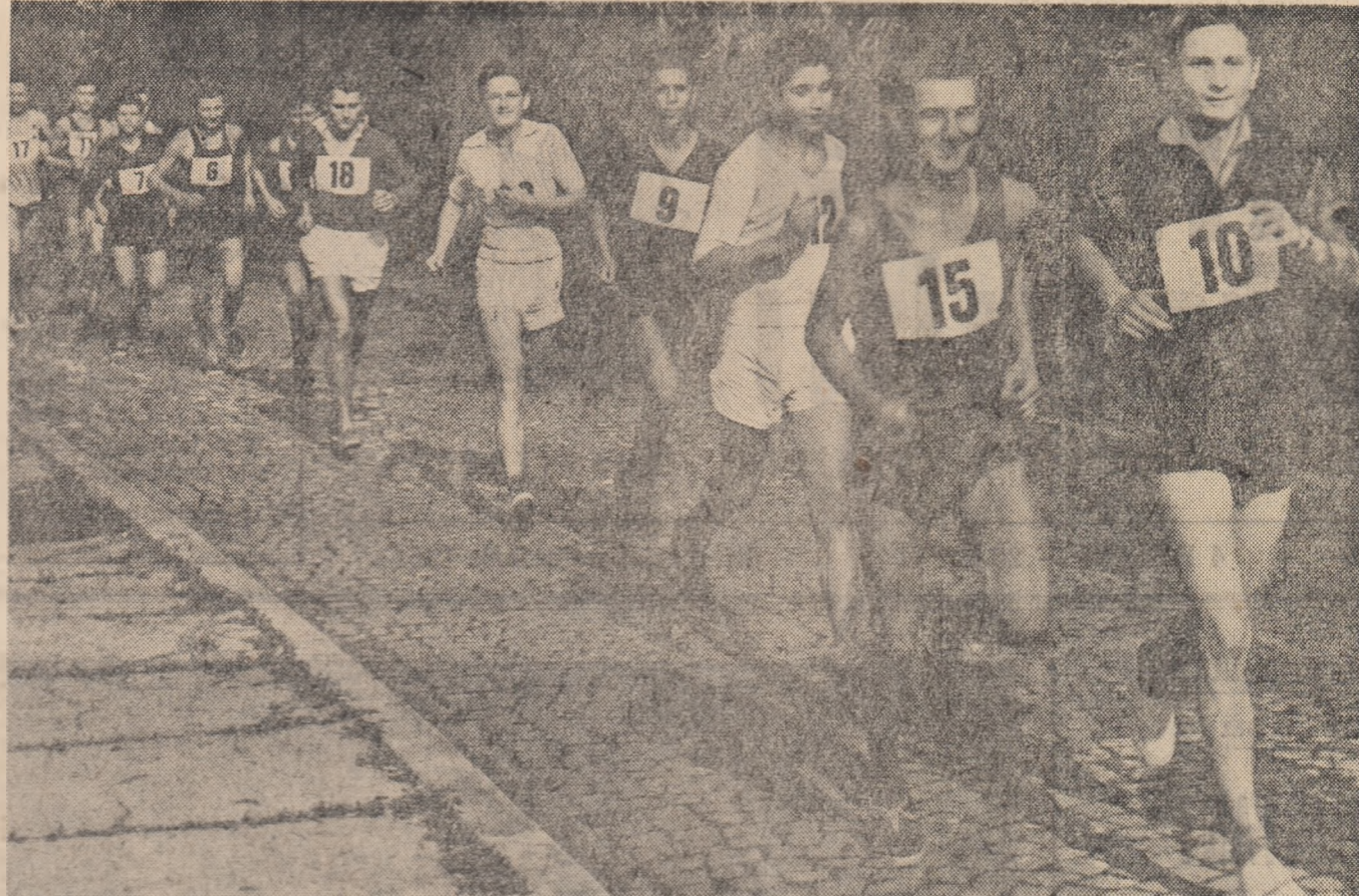
Elevii grupului școlar nr. 4 din București, participă la crosul „Să întîmpinăm 7 Noiembrie”.