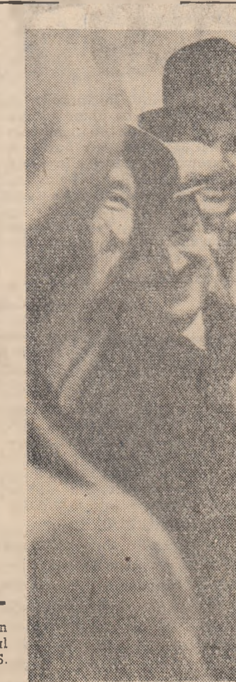
N. S. Hrușciov discută cu un grup de delegați la cel de-al XXII-lea Congres al P.C.U.S.