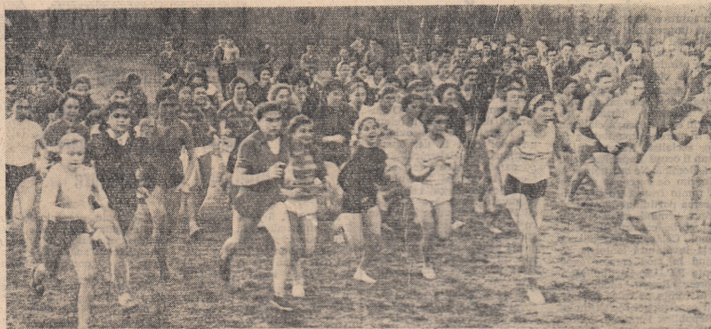
De câteva secunde s-a dat startul uneia din probele feminine de finala pe Capitală a crosului „Să intîmpinăm 7 Noiembrie”