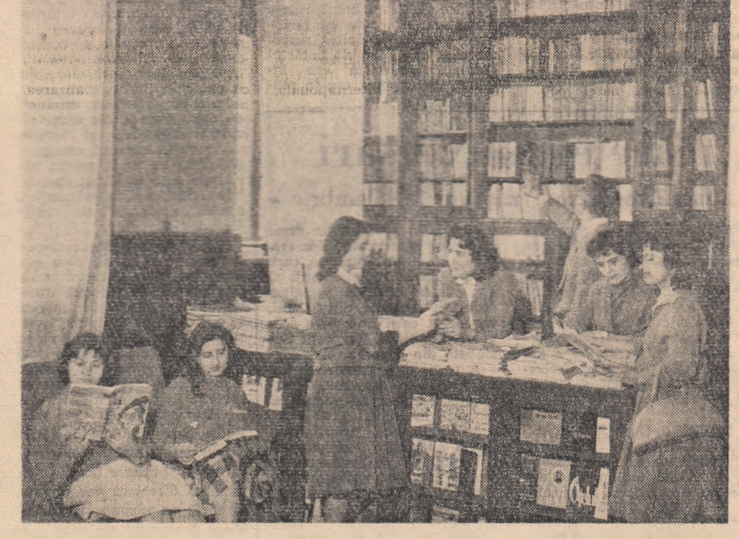
Biblioteca Uzinelor textile „7 Noiembrie” din Capitală cunoaște o bogată activitate. Biblioteca posedă 18.000 de volume și este vizitată zilnic de peste 50 de cititori care vin să împrumute cărțile preferate

Festivalul Filmului Sovietic: M. Gorki, A. Vlaicu; La începutul secolului: 8 Martie, Republica; Vint de libertate; Patria. Gh. Doja, 23 August; Două vieți (seria a II-a); Măghera, București; Invierea: V. Alecsandri, Victoria; Două vieți (seria I); I. C. Frimu; Pinze purpuri; Elena Pavel; Infrînșirea între popoare; Compresorul și vioara — Universiada; Lumina; Cîinele din mîlășină; Central; Cercetător tehnic — Glasurile pădurii — Salutarî din Karlov-Vary — Nigeria — Campionatele internaționale studențești de gimnastică — Nik și Snap în concursul cîinilor frumoși; Timpu Noi; Cîiul de filme pentru copii — dimineața, Romeo, Julietă și întinericul — după amiază; 13 Septembrie; Soarele unui om; Tineretului; El Hakim; Cultural; Cîiul de filme pentru copii — diminea-