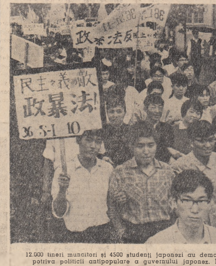
12.000 tineri muncitori și 4500 studenți japonezi au demonstrat recent la Tokio împotriva politicii antipopulare a guvernului japonez. În fotografie: Un aspect din timpul demonstrației

LONDRA. — După cum relatează agenția France Presse, un purtător de cuvânt al delegației partidului Kanu din Kenya a anunțat că Jomo Kenyatta a cerut guvernului britanic să acorde independența Kenyei la 1 februarie 1962.