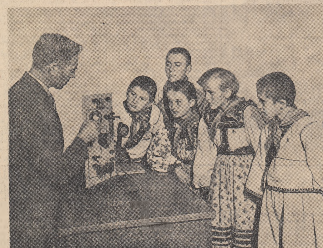
Ord de fizică la școala elementară de 7 ani din satul Trip-Băi raional Oaș.