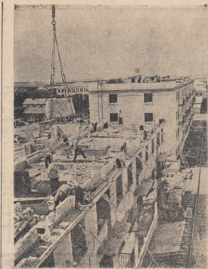
Locuințe în curs de construcție la sovhozul „Komsomolsk” din împrejurimile desjelenite ale Altaiului

Delegația romină — a spus el — dorește să asigure conferința, alături de alte state, va contribui la transparența în viața și scopurilor nobile care stau în fața organizației, aducându-și aportul la intensificarea schimbului de experiență reciproc avantajos al tuturor statelor membre. Noi vom participa la toate acțiunile eficiente care contribuie la dezvoltarea agriculturii în țările care luptă pentru înlăturarea unei moșteniri