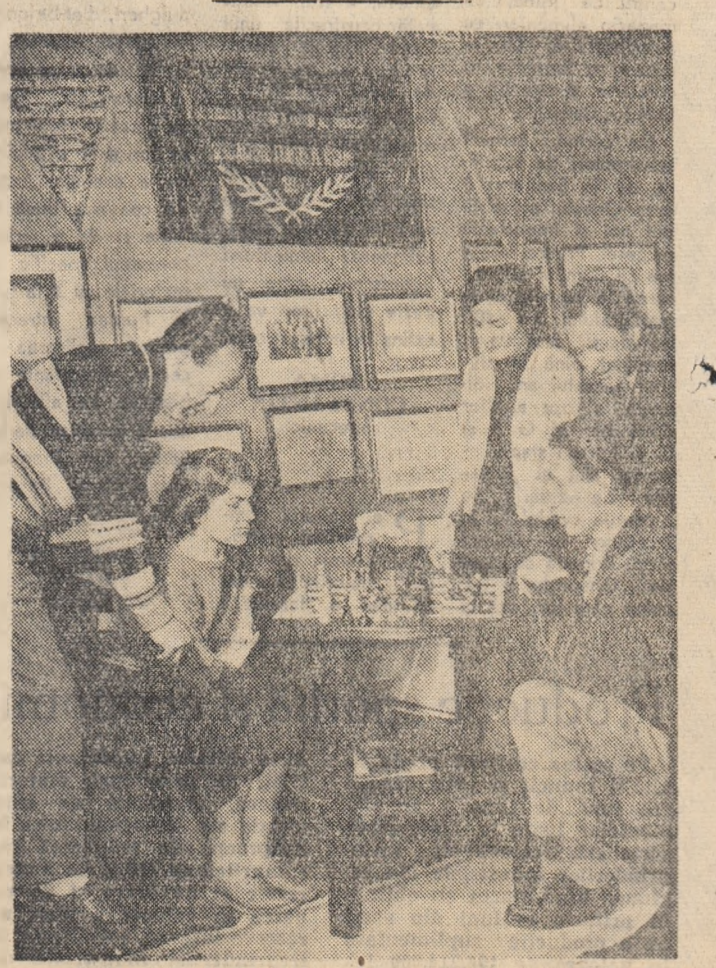
O interesantă partidă de șah la clubul muncitoresc al Trustului regional de construcții din Ploiești.