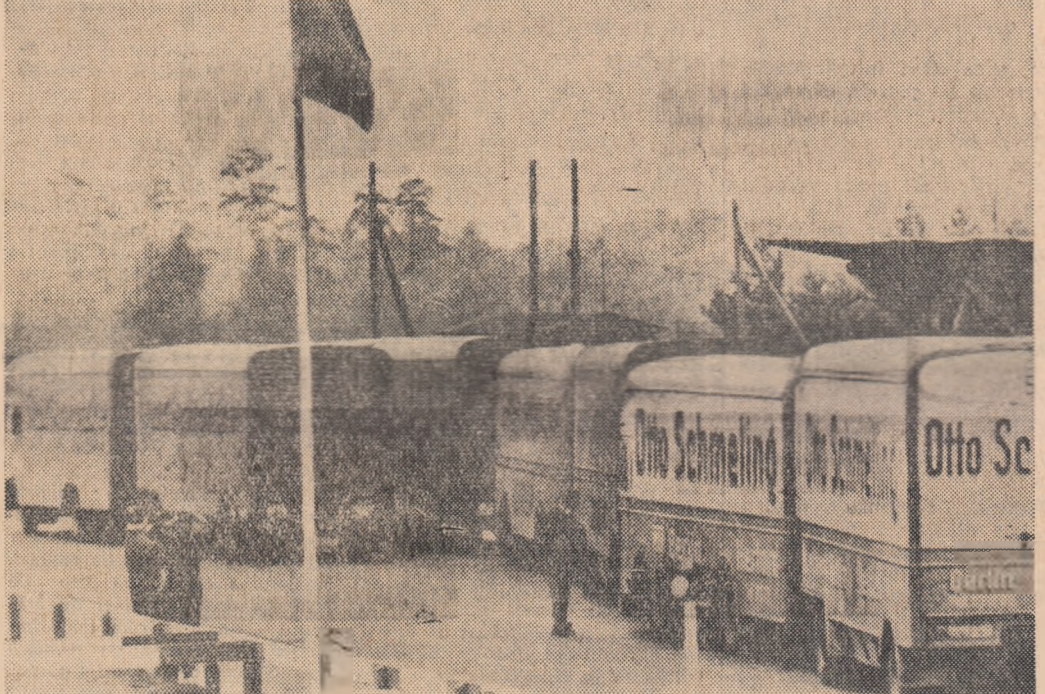
O fotografie la punctul de frontieră DREWITZ în apropiere de Berlinul occidental întârzișia autocamioane încercate cu mobilă, care părăsesc în grabă Berlinul occidental

Toate acestea constituie urmări ale zilei de 13 august — ziua cînd au intrat în vigoare măsurile de securitate ale guvernului R.D.G. În timp ce în Berlinul democratic, domnesc ordinea și liniștea, fiecare cetățean își vede de treburile sale, muncind pentru apărarea realizărilor socialiste, pentru întărirea statului muncitorilor și țăranilor germani, în timp ce locuitorii Berlinului democratic se pre-