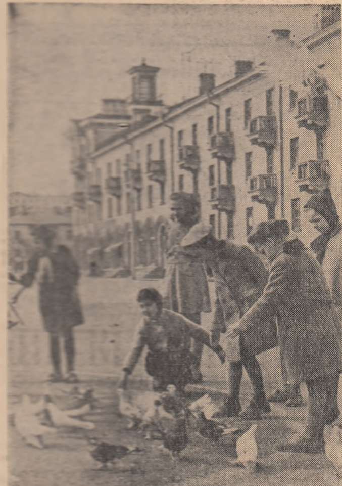
Capitalele fabricii în cadrul orașului Ciocik, centrul industrial constructiv de masă al R.S.S. Uzbec

Ziarul „Avghi” scrie că voturile date pentru Glezos constituie expresia dragostei și respectului poporului față de eroul său național. Guvernul trebuie să țină seama de voința locuitorilor Atenei care au ales pe Glezos deputat în parlament și să-l pună imediat în libertate.