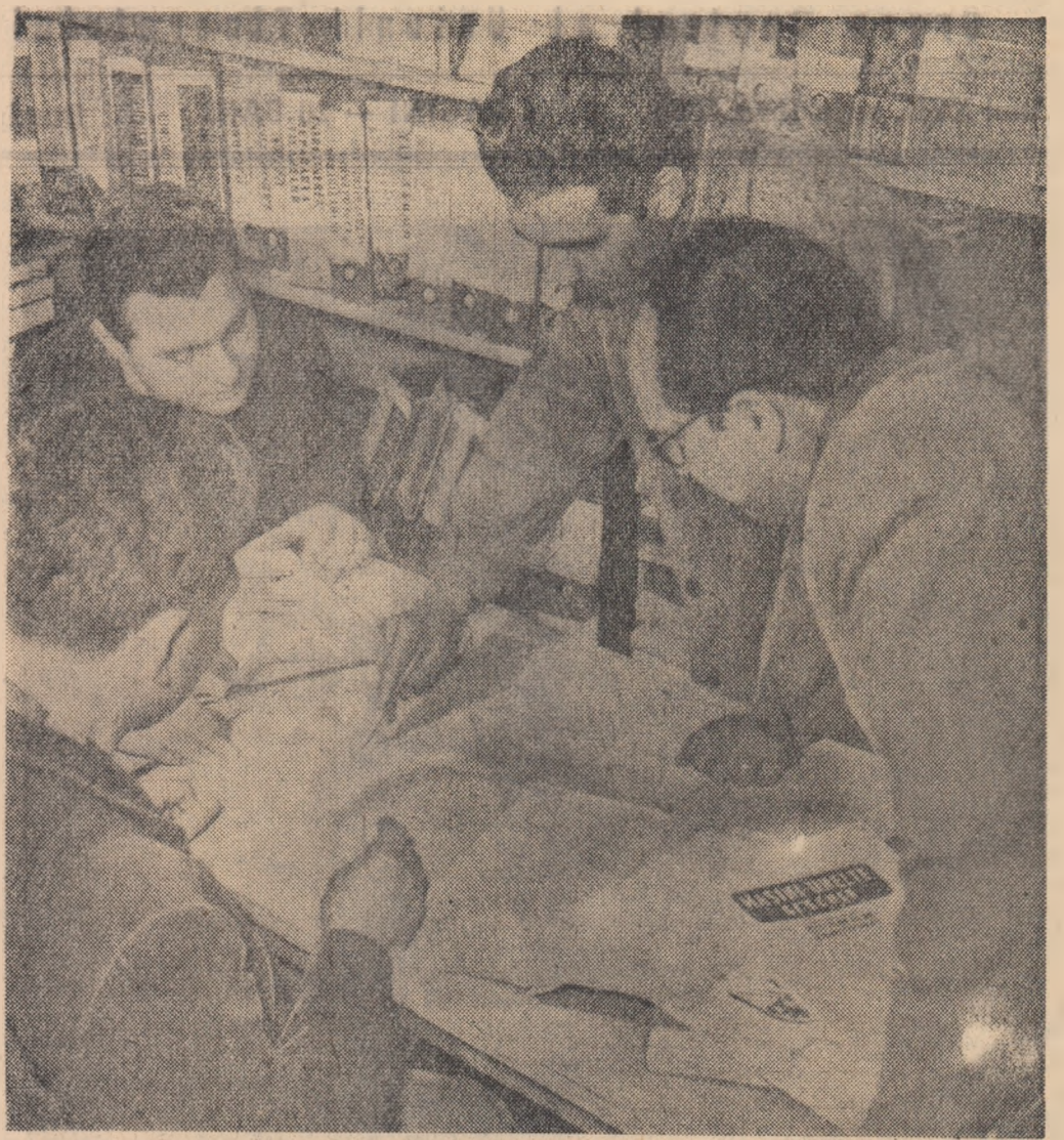
Cabinetul tehnic este unul dintre locurile cele mai prietenoase unde tinerii ingineri și tehnicieni organizează discuții tehnice pentru adîncirea cunoștințelor de specialitate.

În zilele cînd am vizitat uzina, chiar la intrare, un aliat anunța că la clubul uzinei are loc conferința: „Noi metode sovietice folosite în turnăria de fontă și oțel” prezentată de conferințiarul universitar Sofronie Laurențiu.