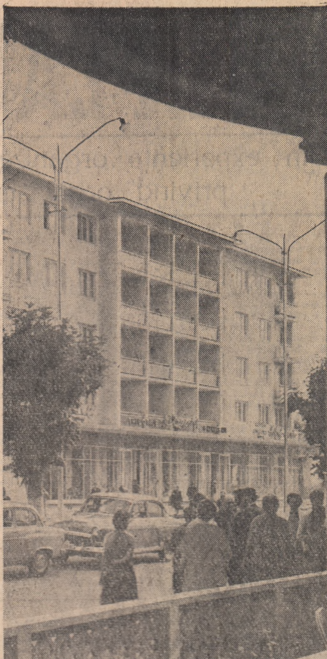
Orașul Bacău devine tot mai frumos

Din experiența organizației U.T.M. de la Uzinele „Steagul roșu” Brașov privind organizarea acțiunii de ridicare a calificării tinerilor