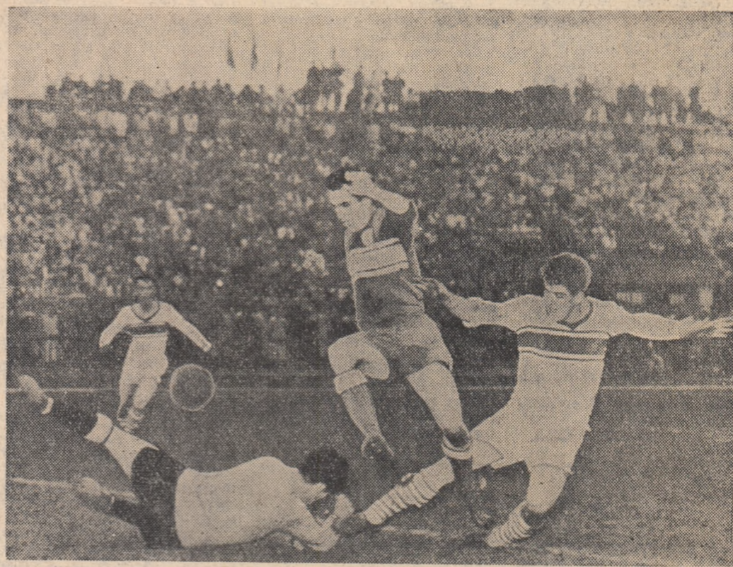
Apărarea „Arieșului” a intervenit prompt și eficient la insistențele atacului ale formației Rapid-București.