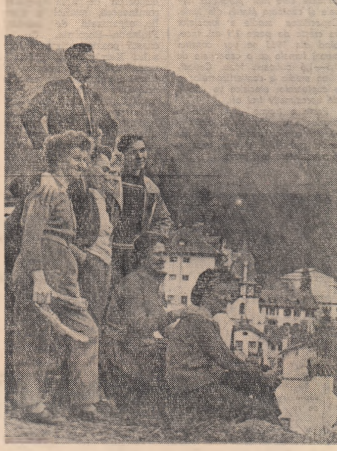
O amintire plăcută din stațiunea de odihnă Sinaia. Aici vin la odihnă tinerii din toate colțurile patriei.