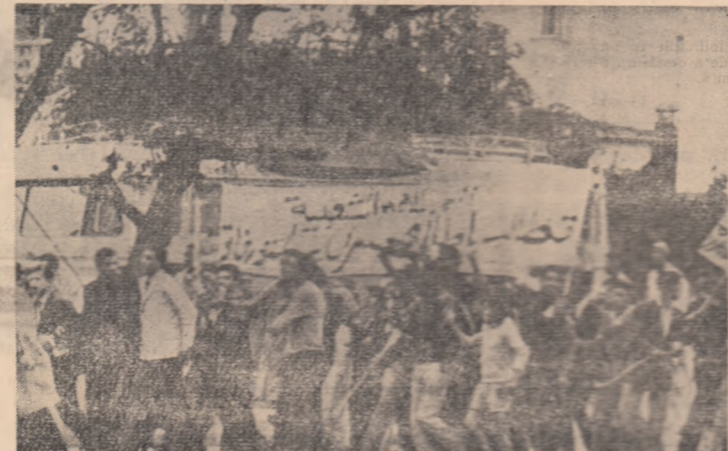
Rabat. Demonstraţie populară în sprijinul conducătorilor elgerieni dezbina la închisoare franceze.

TOKIO. — Dr. Sigeru Yamane, directorul Spitalului municipal din Osaka, a acordat o înaltă apreciere eficacităţii galantaminel — preparat sovietic pentru tratamentul paraliziei infantile. Acest preparat a fost folosit de personalul spitalului pentru tratarea a 43 bolnavi de poliomielită. După 30 zile de tratament, a declarat Yamane, la 62 la sută din pacienţii paralizaţi total a survenit o ameliorare pronunţată, 90 la sută din pacienţii la care a fost înregistrată o paralizie parţială