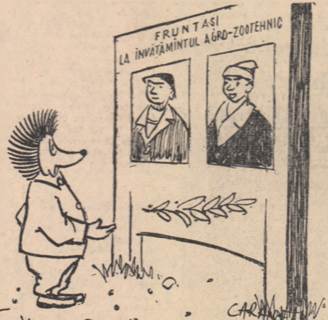
ARCIUG: — ...și ce notă aveți? — 5.000 — ?! — Da, 5.000 kg porumb boabe la hectar. Desen de M. CARANFIL