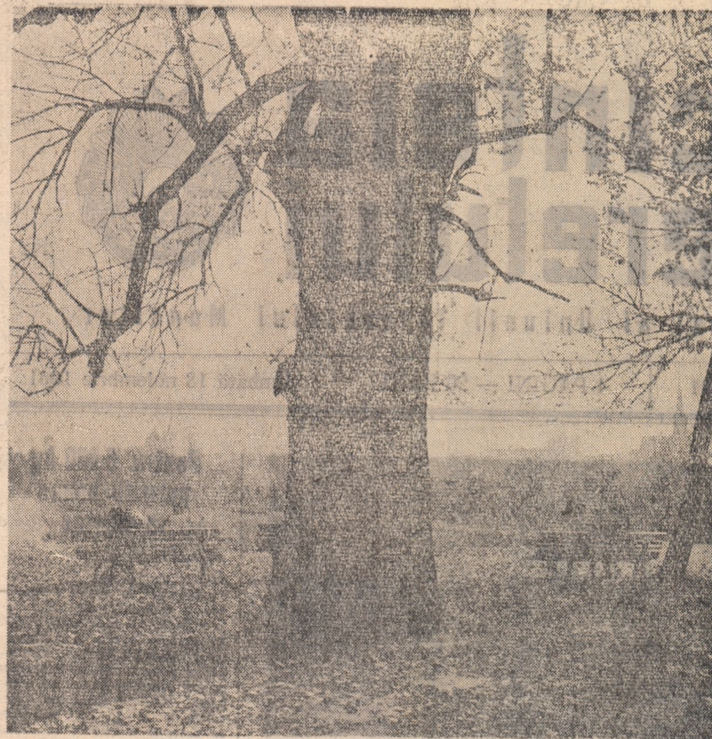
Toamna în pace