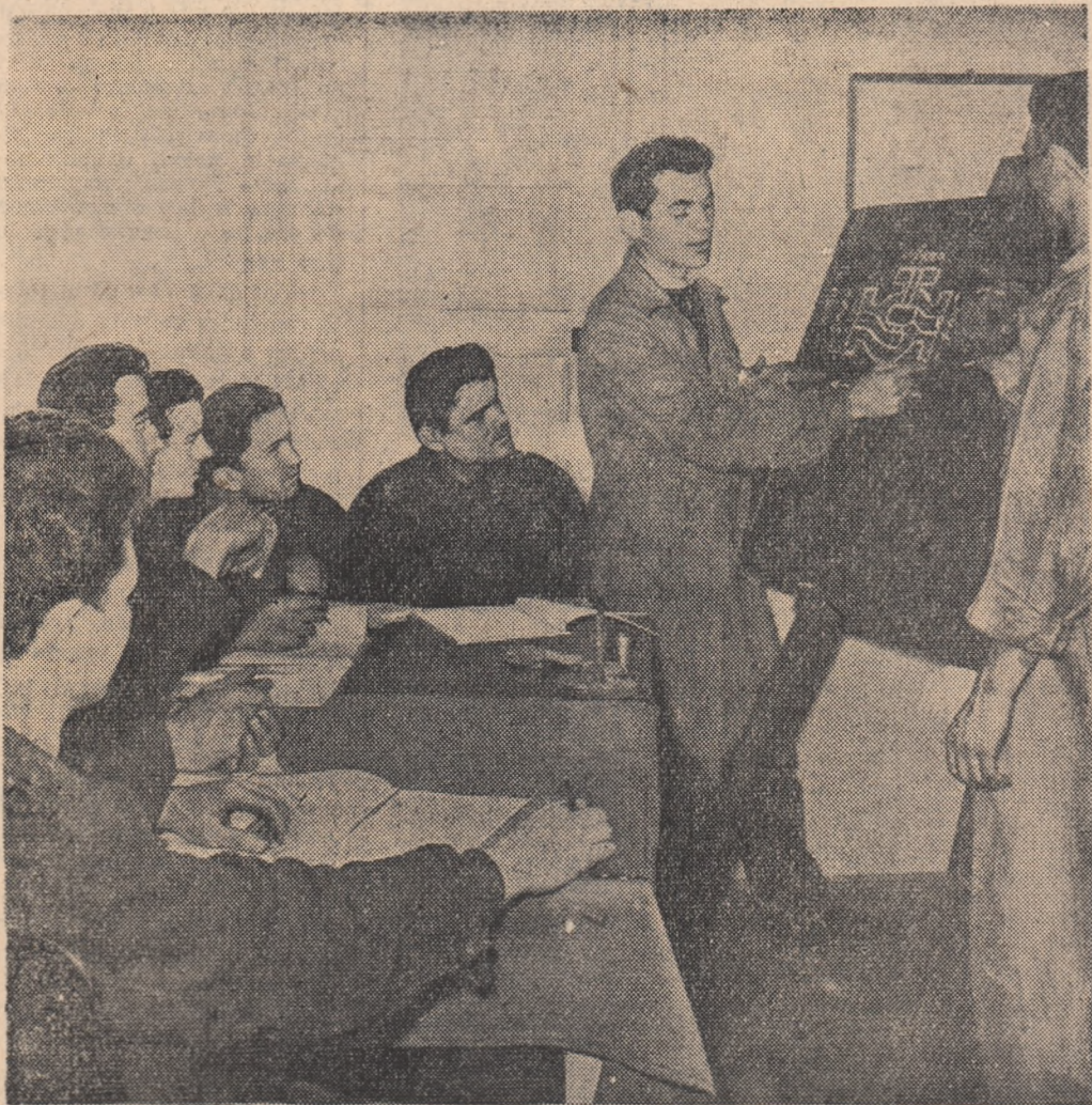
Multe lucruri folositoare învață tinerii de la Uzina mecanică din Galați la cursurile de ridicare a calificării. În timpurile acestea, unde inginerii constanțeni lucrează la fabricarea valvelor de distribuție...