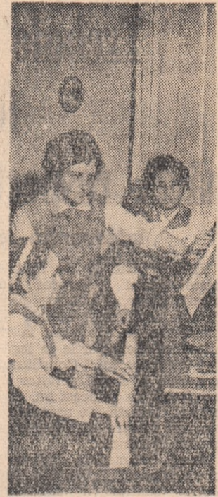
Oră de pian la Școala de muzică și artă plastică din Ecia Mare

Pentru a face cunoscută experiența bună a posturilor utemiste de control frunțase, conferința a hotărît organizarea în primul trimestru al anului 1962 a unei expoziții de gazetele, vorbeste posturile utemiste de control" urmata de o constatare privind munca posturilor utemiste de control. În scopul creșterii rolului educativ al adunărilor generale, pentru ridicarea nivelului dezbaterilor și pentru a doaprea de către acestea a unor hotăriri corespunzătoare, conferința a indicat organizațiilor de bază U.T.M. să atragă la prăgătirea adunărilor generale colective largi de utemisti. Pentru extinderea experienței bune dobîndite în această privință de organizațiile de bază U.T.M. de la fabrica de motoare Diesel, furnale, otelărie și altele, la viitoarelor adunări generale, vor fi invitați să participe secretarii și membrii celorlalte comitete ale organizațiilor U.T.M. de secție. S-a hotărît, de asemenea, ca noul comitet să ajute organizațiile de bază U.T.M. să-și îmbunătățească munca privind informarea