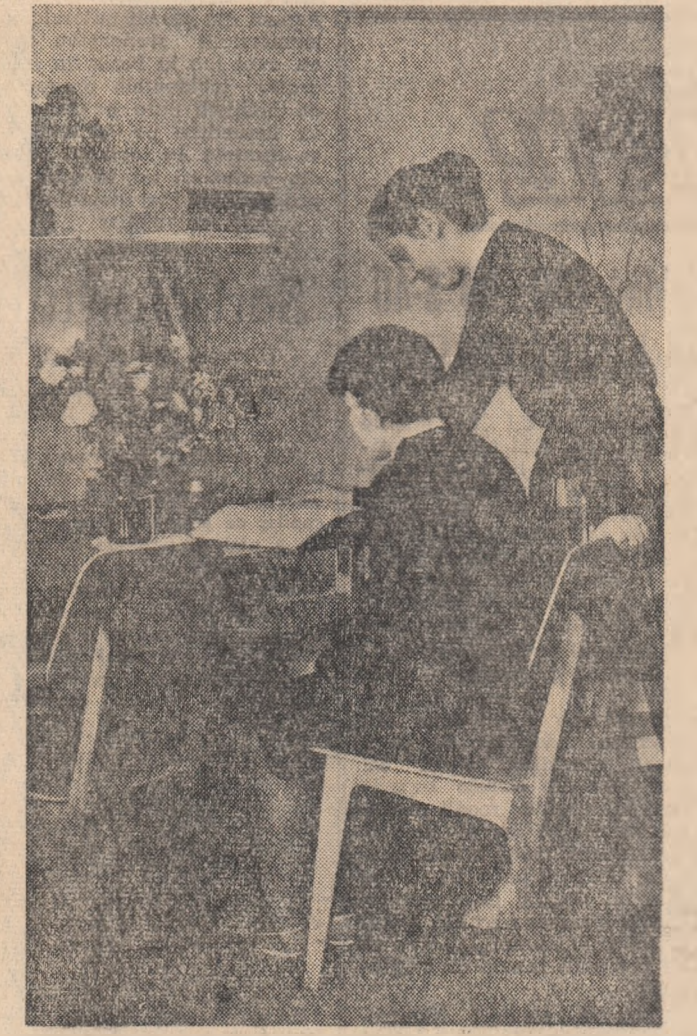
Recent a fost dat în folosință la Craiova pentru studenții Institutului pedagogic de 3 ani, un nou și frumos complex studențesc compus din două blocuri a 330 locuri precum și o cantină unde pot lua masa zilnic 600 studenți. În fotografie: Într-una din camerele dormitor ale studenților.

Mateescu, președintele Centrocopului. Convorbirea a decurs într-o atmosferă prietenească. Simbătă seara, la clubul Universității „C. I. Parhon” din Capitală a avut loc un simpozion dedicat centenarului Risorgimentului, organizat de cercul științific de limbă și literatură italiană al Facultății de filologie. (Agerpres)