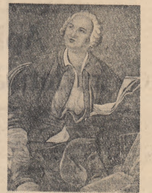
zică teoria atomistă anticipată a lui Dalton, care afirmă că materia este compusă din molecule și atomi.

El a fost preocupat de punerea în valoare a marilor bogății minerale ale Rusiei. Ideile lui Lomonosov despre schimbările din natură expuse în cartea sa „Despre straturile pământului” au avut o uriașă importanță în dezvoltarea științelor. Lomonosov a avut ca fundament științific și să explice originea naturală a minelor, mineralelor, cărbunelui, petrolului, transformarea apei, a organismelor vegetale și animale.