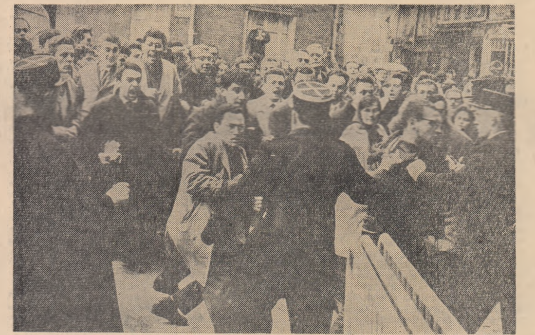
Aspectul cursului studentesc care au avut loc la Paris. În fotografia din dreapta se vede grupul de poliști care au încercat să împiedice pe studenți să se apropie de locuința unuia din profesorii lor, la care s-a produs recent un atentat ultracolonialist.

Ministerul Afacerilor Externe al U.R.S.S. a atras atenția Ambasadei R.F.G. din U.R.S.S. asupra faptului că, în îngăduință vădită a Republicii Federale Germane, organele de spionaj ale S.U.A. din Germania occidentală continuă să folosească cetățenii ai R.F.G. pentru desfășurarea activității de spionaj pe teritoriul U.R.S.S.