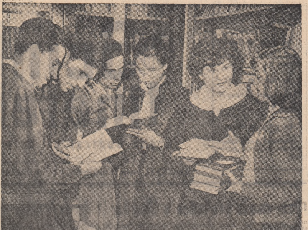
Standul de cărți al Uzinei mecatice din Galați este vizitat cu interes de tinerii muncitori ai uzinei.

AI 18 ANI Mal multe zări cu visuri te-ncorajază, Al opsisprece an și toți se-avintă Cu aripi largi deschise peste țară — Un univers de muncă și labintă! Lumina se desvânde mai gravă Și-un pic romantic, te visezi matroz Pe-a fesenatului superbă navă Vizind pe cerul apoi luminos. Te caută alții ochi din jur Și-aițea mână se-ntind fierbinți spre tine — Ești om de opsisprece an, matroz, Și ești nădejde-a zilei care vine! In rând cu cei mai buni și vechi oțetși, Partidul mersu stăruind cu clase, Ați porți răspundere de-a fi părțoș La ridicarea lumii comuniste. In arborii pădurii de luncă Să încrustezi un semn — flacără plină — Oțelul viu al țării tale Să îl revorți în șarje de lumină! Te cheamă sus, din marmură și stel, Albastre trepte universitare — Un gram de cifre și idei Cu drumuri și orzoșe viltoroșe... Mal multe zări cu visuri te-ncorajază Un univers de muncă și labintă. Al opsisprece an și toți se-avintă Cu aripi largi deschise peste țară A. I. ZAINESCU