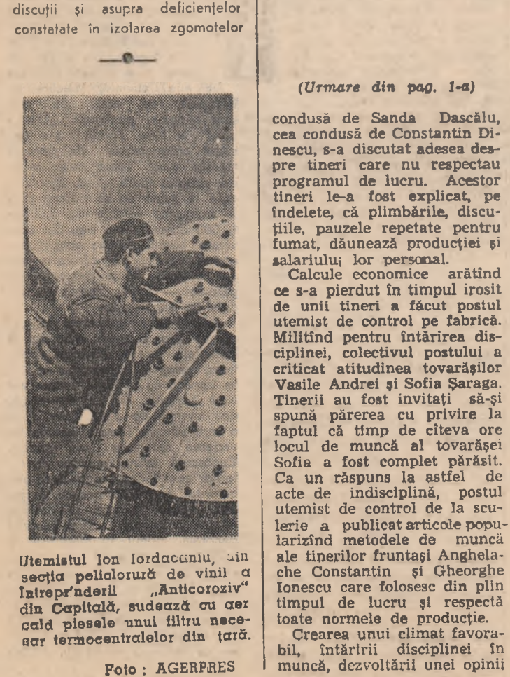
Utemistul Ion Iordăciuanu, din secția pectorală de vină a întreprinderii „Anticoroziv” din Capitală, sudază cu aer cald pisele unui filtru necesar termocentralelor din țară.