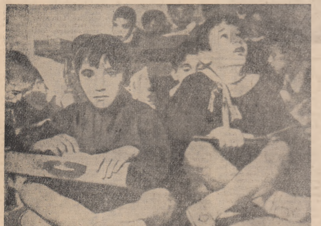
112 copii sînt înghesuți în această sală de clasă din Palermo. Din această pricină mulți din ei sînt în timpul orelor de curs pe dușumea.