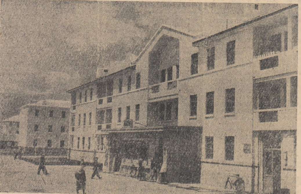
Noile blocuri de locuințe pentru muncitorii Combinatului Industrial «Ciobalsan» din Ulan-Bator.

Cu prilejul celei de a 37-a aniversări a proclamării Republicii Populare Mongole, tineretului nostru popor, transmite poporului și tineretului mongol un fierbinte salut frățesc și îi urează noi succese în construcția socialistă și în lupta pentru apărarea păcii în lume.