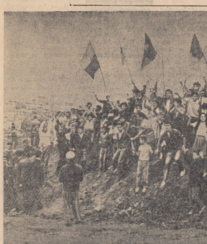
Portind drapele F.N.L., tineretul algerian demonstrează împotriva politicii colonialiste, pentru independența Algeriei

În răspunsul la scrisoarea lui J. Bernal, din 15 noiembrie adresată șefilor guvernelor celor patru mari puteri, Nikita Hrușciov scrie: «Sintem gata pentru această și celelalte țări cărora v-ați adresat să nu încetăm să luăm în considerare experiențele noastre în materie de armă nucleară».