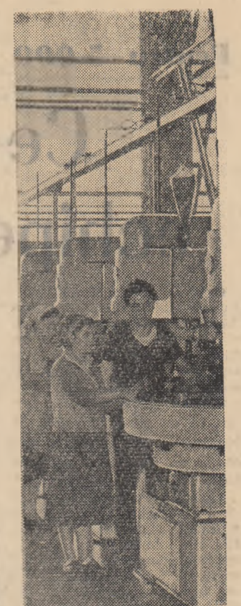
Vedere a unuia din liniile automate de mașini de tocitificat de la Uzinele „Rulmentul” din Brașov.