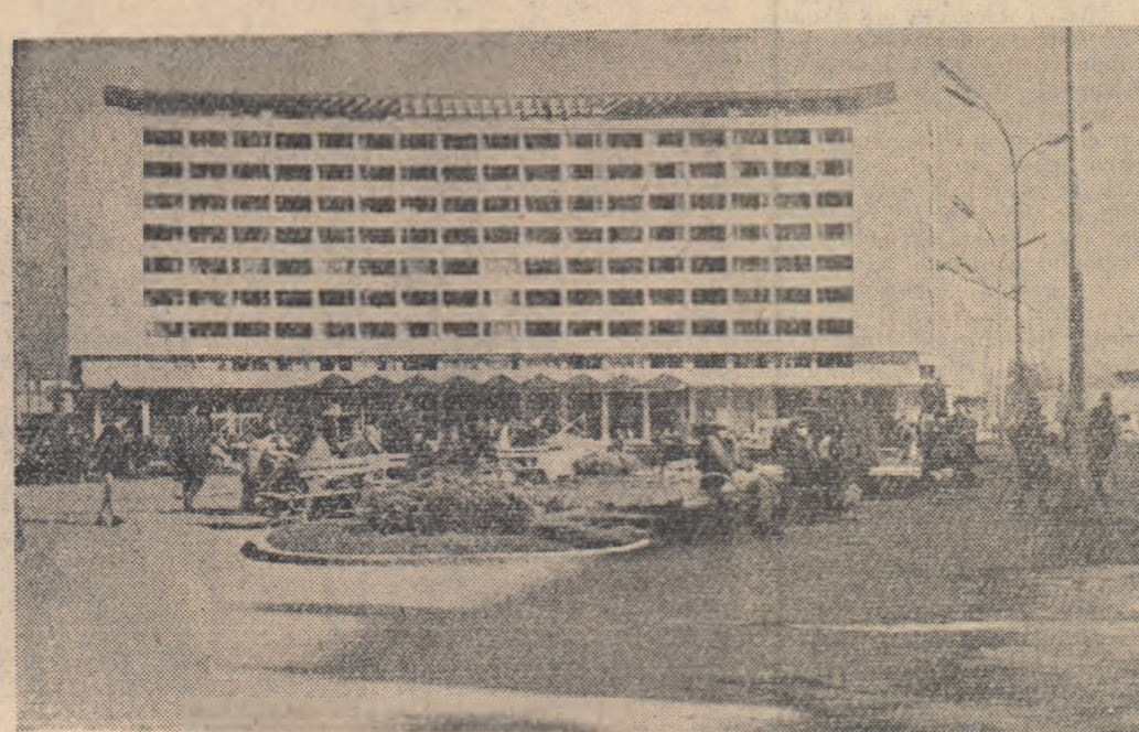
O nouă construcție în piața Mihai Viteazul din Cluj