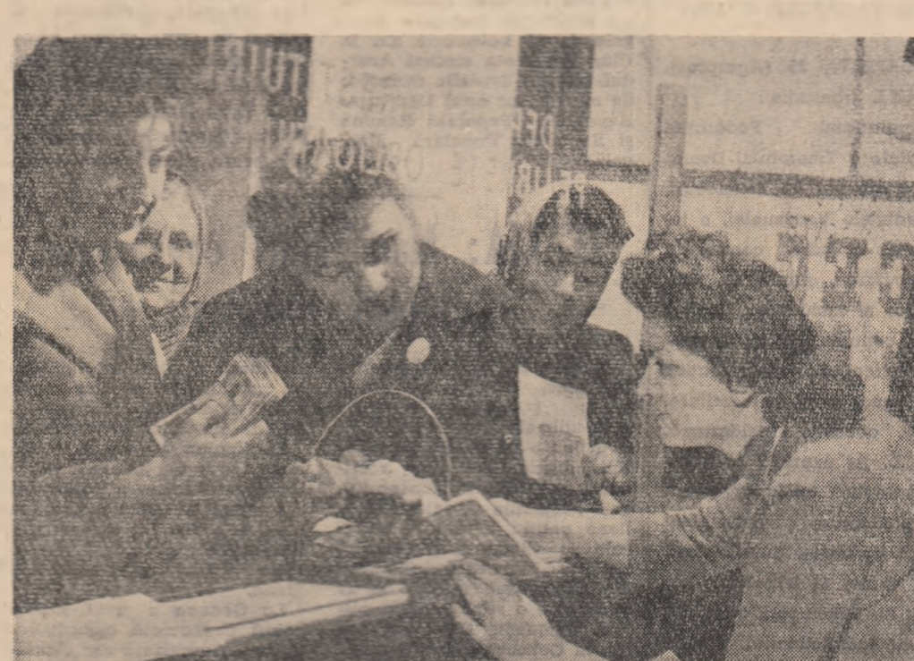
„Săptămîna economiei”. La agenția C.E.C. din Bd. Magheru nr. 24 din Capitală se depun zilnic peste 200.000 lei.

Stimulînd activitatea tinerilor, inițiativele lor, ajutîndu-i să-și îndeplinească mai bine sarcinile, organizația U.T.M. s-a ocupat îndeaproape de