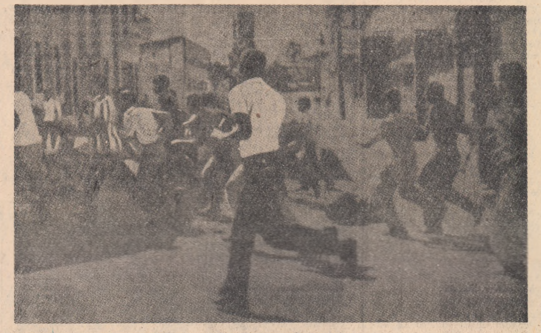
Un grup de tineri din Republica Dominicană își exprimă mînia împotriva guvernului Balaguer