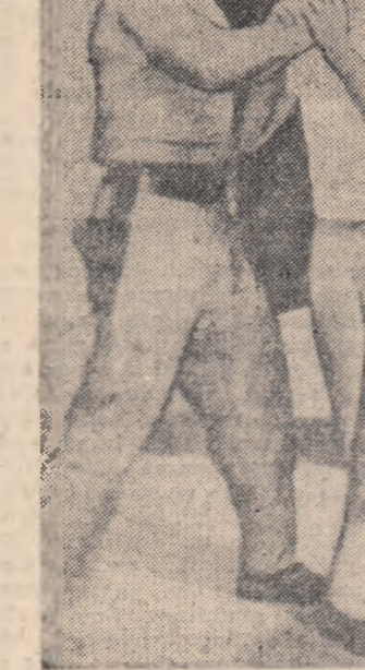
Santo Domingo — capitala Republicii Dominicane. Fotografia pe care o reproducem după ziarul „Volksstimme” arată cum poliștii lui Balaguer aștează pe unul din demonstranții care au manifestat împotriva actualului regim dictatorial.

IOSIF PIKAREVICI Correspondent al Agenției de presă „Novosti” Moscow, decembrie 1961