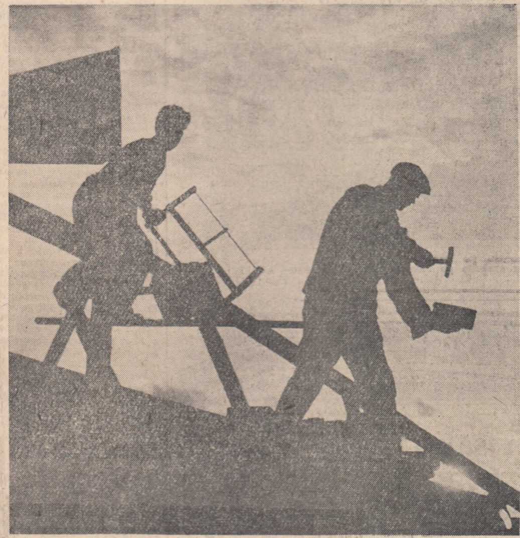
Pe schele.

Brigada condusă de Codrescu Constantin de la secția turnătoriei a uzinelor „Timpuri Noi” și-a îndeplinit de curînd sarcinile planului anual de producție. În fotografie: o discuție în brigadă în legătură cu calitatea formelor executate.