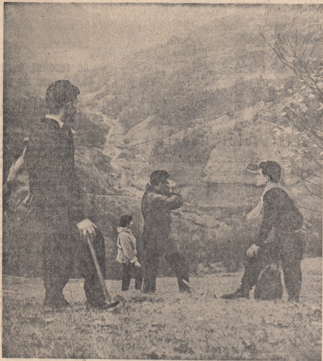
La exorziu pe Muntele Reoc.