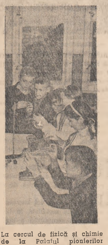
La cercul de fizică și chimie de la Palatul pionierilor din Cluj.