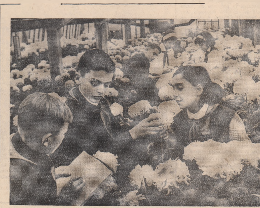
La sera tinerilor naturalisti din Timișoara