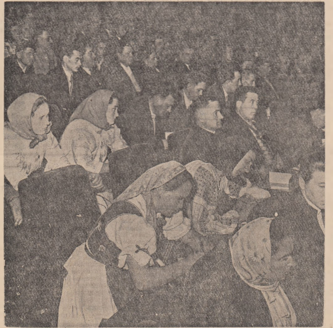
Aspect din sala Palatului R.P. Romîne în timpul Consfătuirii.

Astfel, după terminarea colectivizării, într-un număr de 27 gospodării agricole colective, nu erau organizații de partid, iar 60 de organizații erau mici, cu 3-5 membri. Datorită îmbunătățirii muncii de partid în partid a celor mai buni colectivisti, în toate gospodăriile colective există acum organizații de partid.