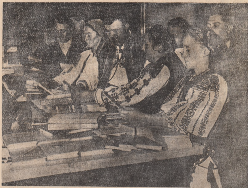
Standul de cărți este cercetat cu atenție de către colectivitățile.

Alături de porumbul siloz, trebuie să producem — a spus în continuare vorbitorul — cît mai multă mazăre, soia, trifoi, lucernă, și alte furaje bogate în proteină. În fiecare gospodărie colectivă trebuie să organizăm loturi semîner care să asigure producerea întregii cantități de semînte de furaje necesare ca: lucernă, trifoi, mazăre, soia și sfecla de zahăr.