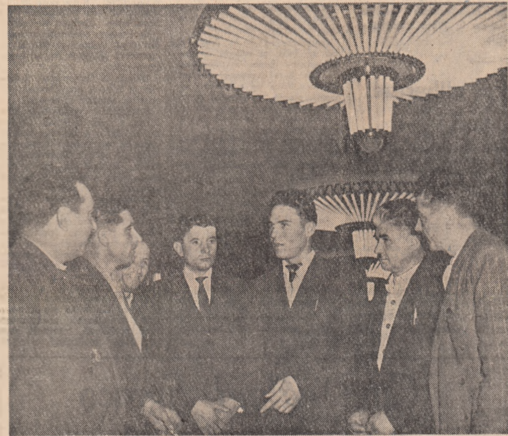
Un grup de delegați din regiunea Galați într-o pauză.

După ce s-a referit la problema cultivării legumelor, vorbitorul s-a ocupat de creș-