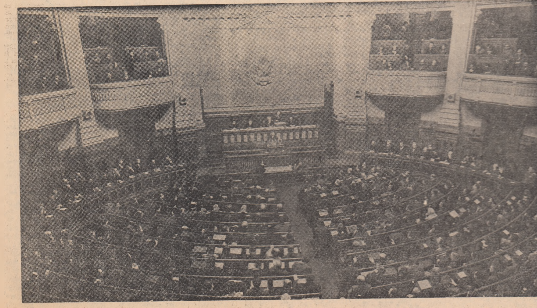
Aspect din timpul lucrărilor sesiunii Marii Adunări Naționale

— 1961 se adaugă la șiragul anilor noștri rodnic — ne spune EUGENIU OBREA