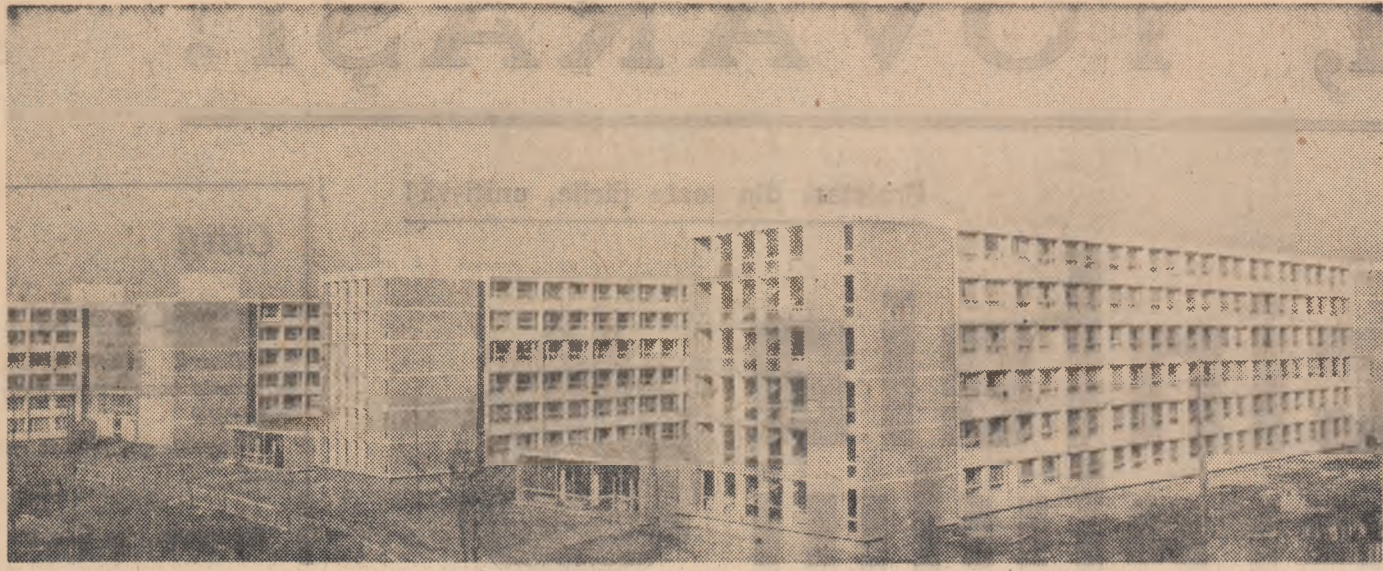
Vedere a noului complex studențesc cu o capacitate de 2.000 de locuri dat de curând în folosință pe Splaiul Independenței din Capitală.