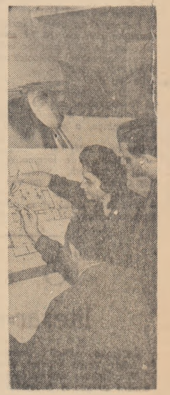
Pe planșetele proiectanților se nasc importante obiective tehnice.

Specialiștii consideră că folosirea combinăi va provoca o adevărată revoluție în construcții.