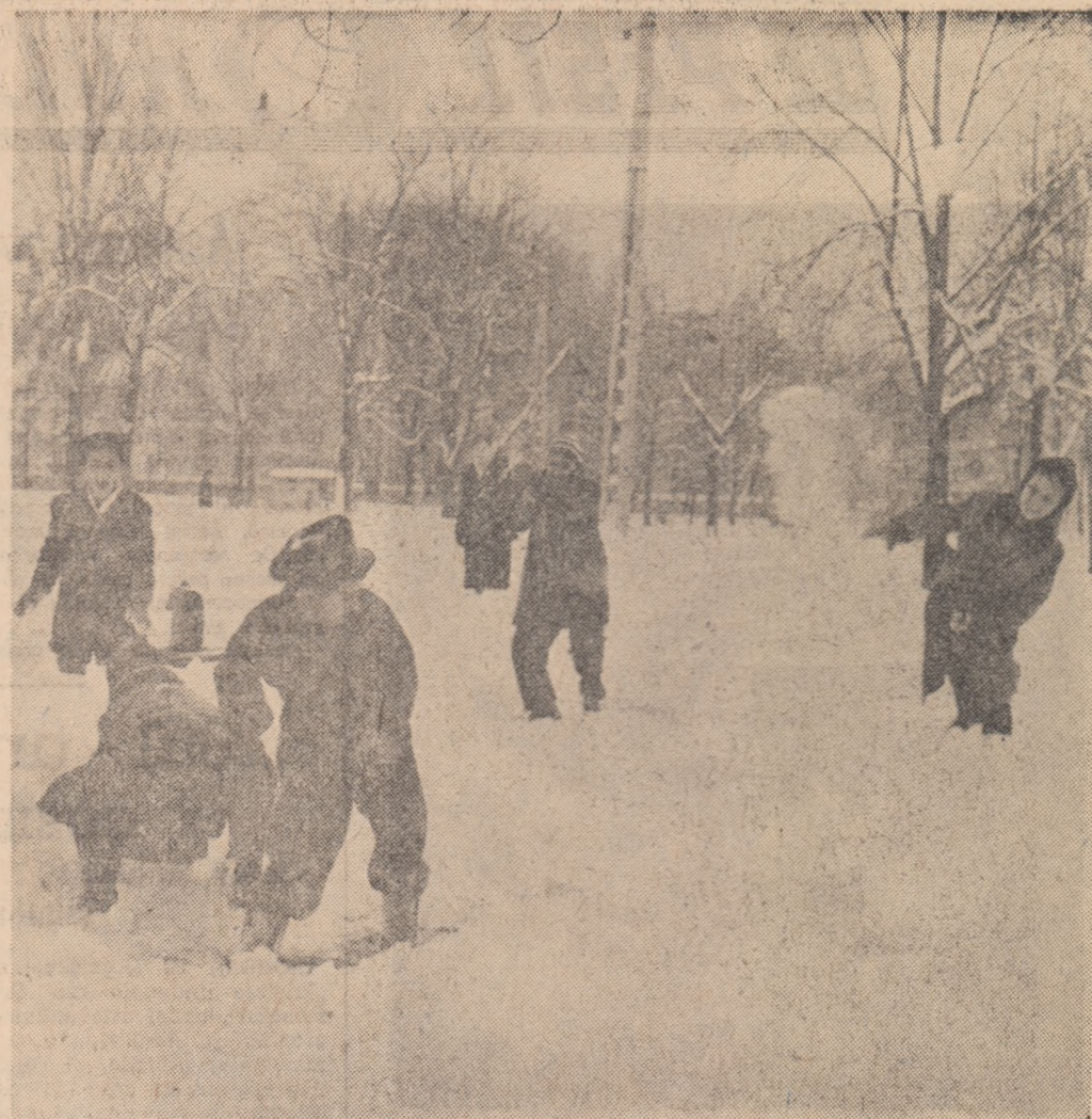
Una din marile bătălii înscise în această vacanță.

4. Rezultate de prim plan în întrecerile din Franța, Elveția și Austria.