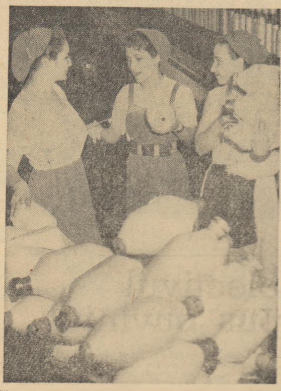
Filătura Dacla, București. Tineri frunzăreți din secția filaturii, în prima zi de muncă a anului 1962.