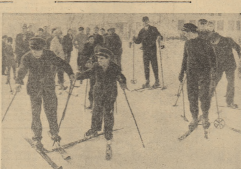
Vacanță... Primele lecții de înot în schi încep cu probele de tand. Ele își dezvoltă rezistența și își asigură echilibrul...

În primele trei zile ale anului, la instalațiile rașnărilor ploieștine în care locul arde continuu a fost prelucrat cu 8—10 la sută mai mult țel pe schimb peste plan. În total în primele zile ale anului au fost obținute în plus față de plan peste 6.200 tone benzină, uleiuri minerale și alte produse petroliere de bună calitate.