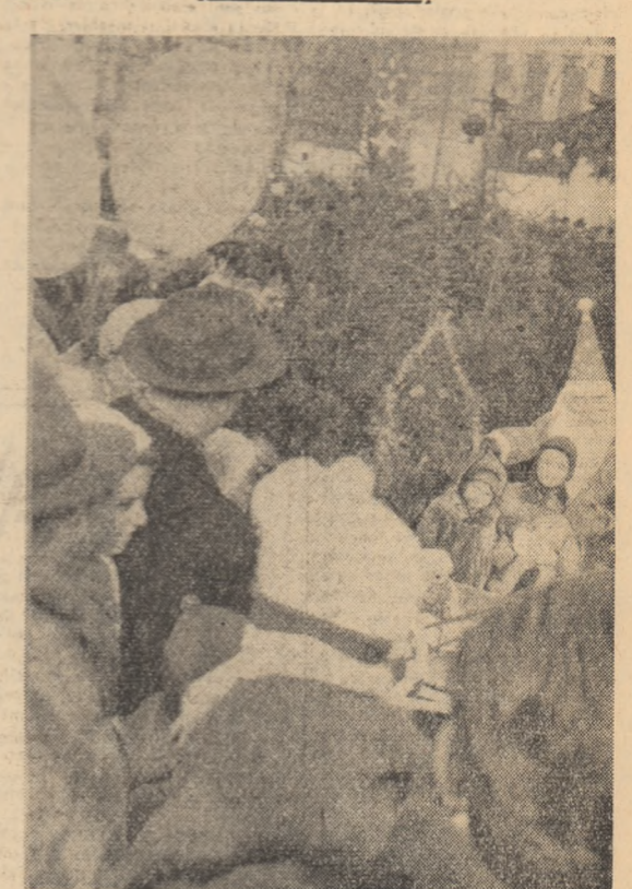
În orașul copiilor din Piața Palatului din Capitală.