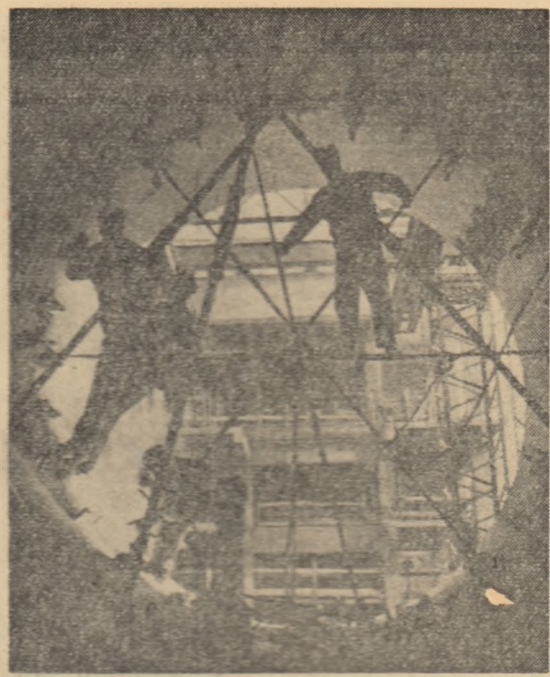
Pe șantierea de construcție a unei centrale pentru producerea energiei electrice și a unui vas V.A.C. (R. P. Ungaria) care va fi terminată în sfîrșitul anului 1962.

Plenara a condamnat politica dusă față de Cuba de guvernul Columbiei. Solidaritatea cu Cuba, consideră plenara, este o sarcină a întregului popor columbian.