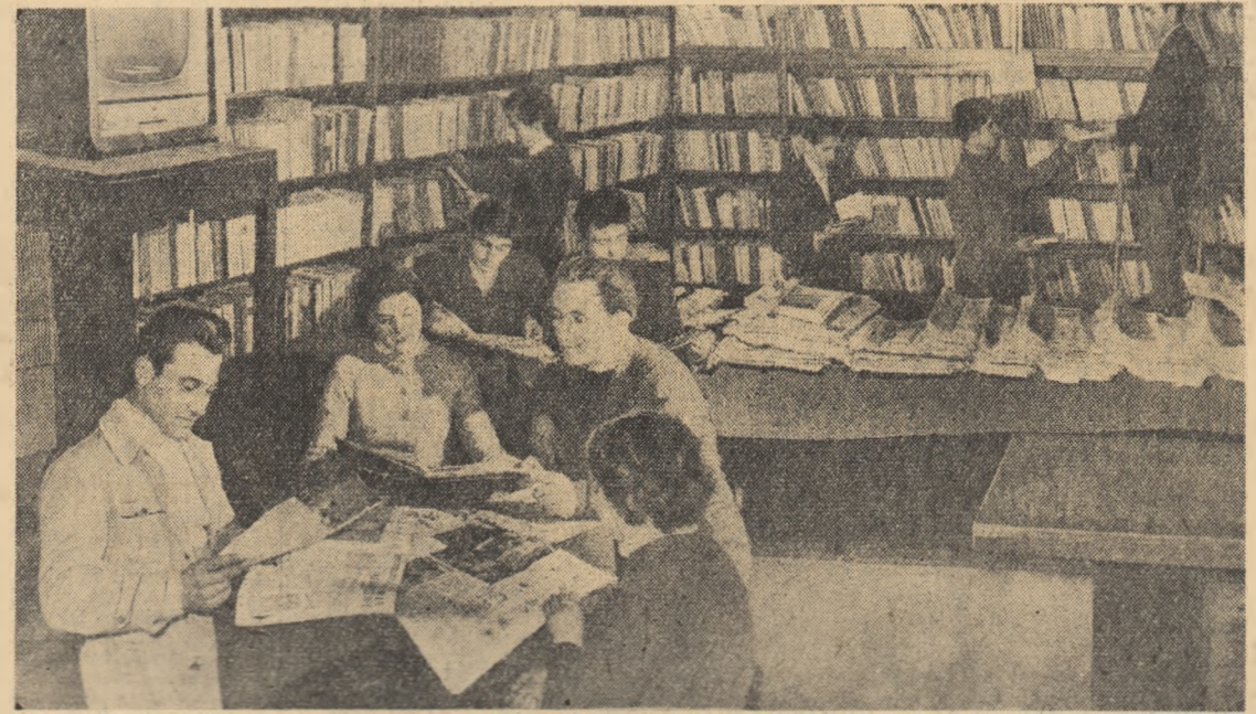
La clubul Uzinelor: de strunșuri din Arod