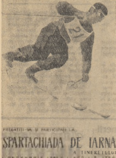
SPARTACHIADA DE IARNA A TINERETULUI

— Obiectivul numărul unu al sezonului nostru ciclist este participarea la tradiționala întrecere de emolare mondială „Cursa păcii”. După cum se știe, a XV-a ediție a „Curselor Păcii” este cea mai dificilă de pînă acum: 14 etape, 2.400 kilometri.