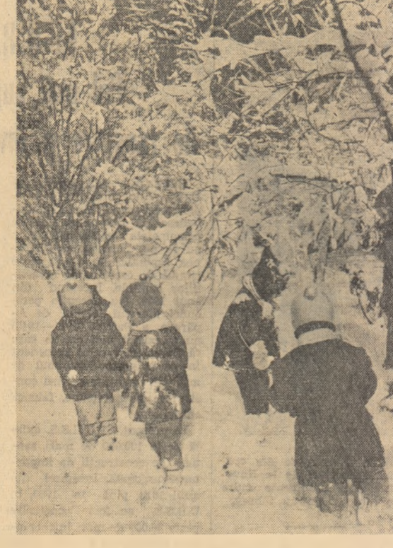
Iarnă în Cîmșigiu