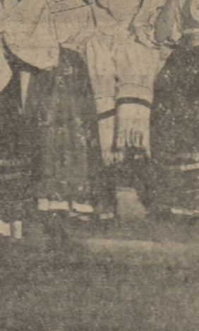
Moment dintr-un spectacol al Ansamblului de cîntec și dansuri al C.C.S.

Articolul „Cum sînt ajutați tinerii să învețe” a constituit obiectul unor largi discuții în comitetul U.T.M. Impresia cu comitetul sindicalului și cu ajutorul conducerei uzinei a luat măsuri concrete menite să reorganizeze cursurile de ridicare a calificării profesionale pe secții și meserii. Au fost înființate 18 cursuri pe profesii și pe grade de calificare: pentru strungari, mecanici, lăcătuși, oțelari, turnători, frezori, electricieni etc. Pentru a fi cuprinși toți tinerii s-a hotărît ca lecțiile să fie predate pe schimburi, ur-