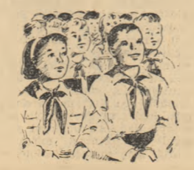
colarii sînt în plină vacanță și din programul celor mai mulți dintre ei nu lipsesc în aceste zile

Pe lângă antrenamentele de schi și excursiile organizate prin munții Cibinului, programul taberei cuprinde și plăcute activități culturale — în cadrul cărora sportivii noștri vor auzi muzică și vor dansa. Într-o zi în tabăra, elevii turști vor porni cu atînt la curcerea încă unui trimestru.