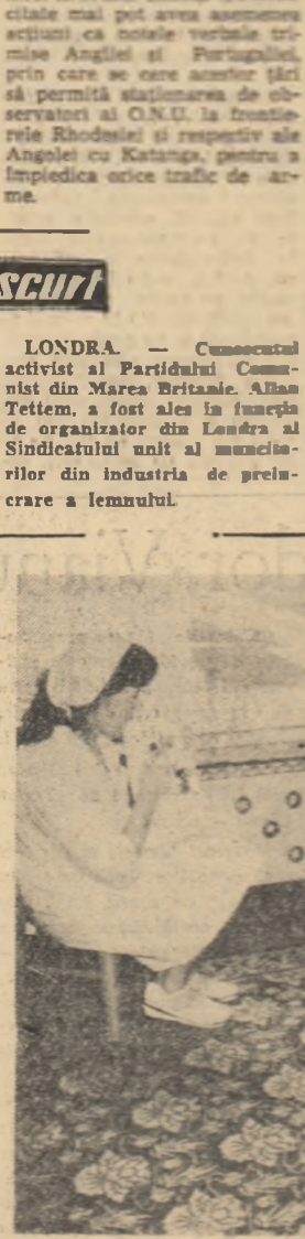
Aspect de la o grădiniță de copii din noul cartier al orașului Sofia — „Parcul de Vest”