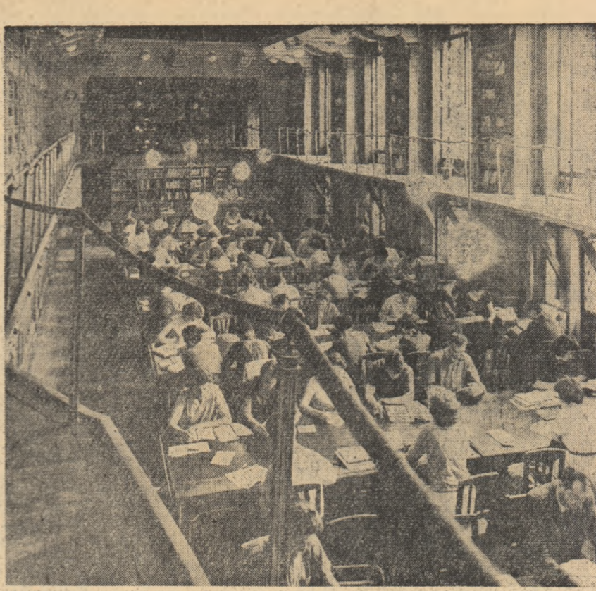
In aceste zile în biblioteca