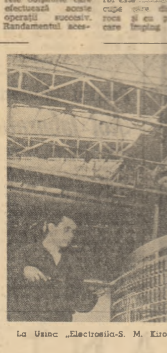
La Uzina „Electrosila-S. M. Kirov” din Leningrad: se lucrează la montarea unui nou agregat uriaș