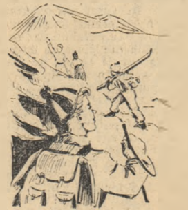
Carpați am călătorit pe Valea Prahovei împreună cu alte grupuri de elevi. Călătoria cu trenul pînă la Sinaia ne-a dat mari satisfacții și bucurii.

Am rămas impresionați de frumusețea Văii Prahovei și a munților acoperiți de nea. La Sinaia am fost oazați în vile deosebit de frumoase și confortabile.