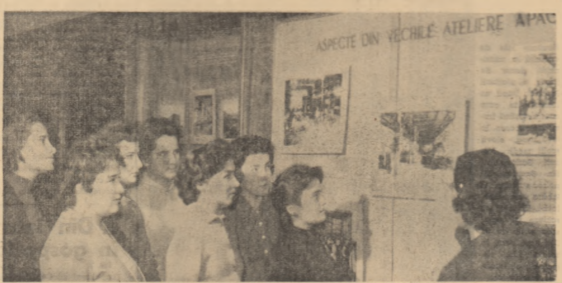
Compararea dintre viața grea a muncitorilor în trecut și condițiile minunate de muncă și de trai create oamenilor muncii de regimul nostru democratic popular serveste propagandistul la munca de educare politică a tinerilor cursanți. În acest sens, expoziția organizată la clubul Fabricii de confecții și tricouri București II este de un real folos.