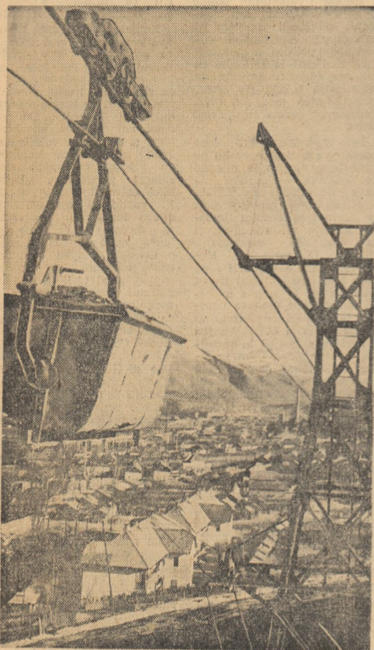
Vedere spre orașul minier Petritu, de pe linia funicularului ce leagă mina Aninoasa cu preparăția de la Petritu.