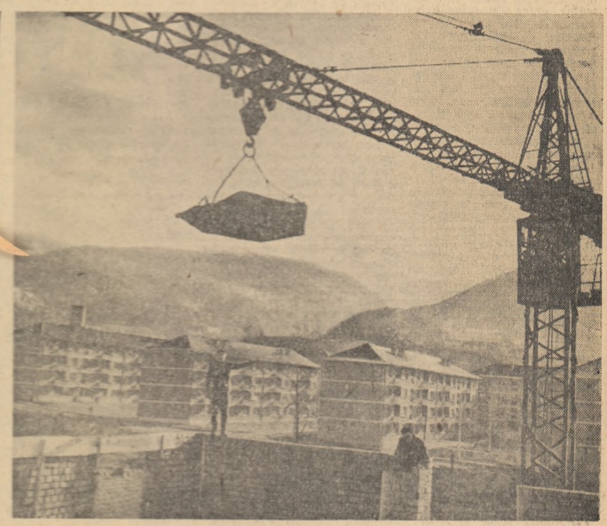
La Lupeni se desfășoară intense lucrări pentru construcții de locuințe. In fotografie: aspect de pe unul dintre șantierele orașului