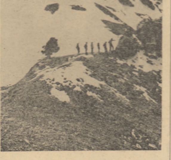
Pe creasta Bucșorului, spre Omul