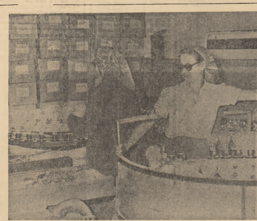
Ultima operație — controlul plesselor executate. Si de data aceasta becuriile fabricate la Fabrica „Stema electrică” din Fieni sint de buna calitate.