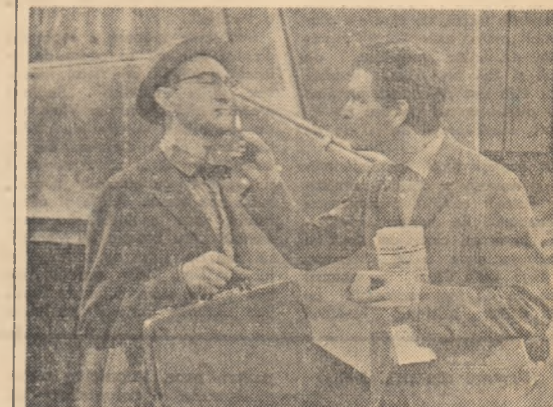
O producție a studioului cinematografic „București“ Scenariul și regia: ION POPESCU-GOPO