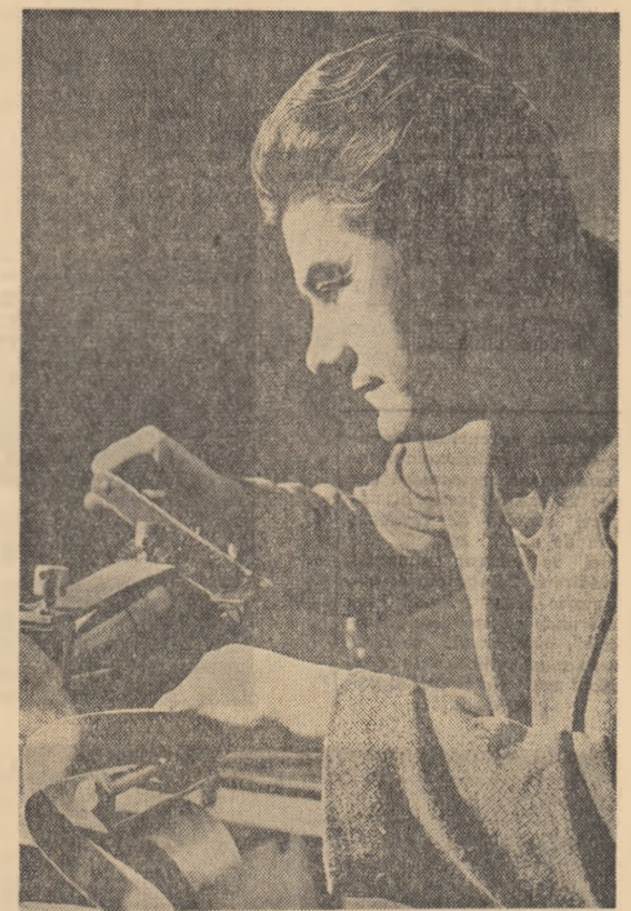
Să zicem că undeva, pe un câmp, în plină campanie agricolă, s-a oprit o semănătoare: tubul de conducere a semințelor s-a defectat. Nu-i nimic. Cu acest dispozitiv simplu, creat de un colectiv de ingineri și tehnicieni de la Institutul de cercetări pentru mecanizarea și electricizarea agriculturii, totul va fi răstăcut într-un timp foarte scurt și lucrul va putea continua nestinghit.