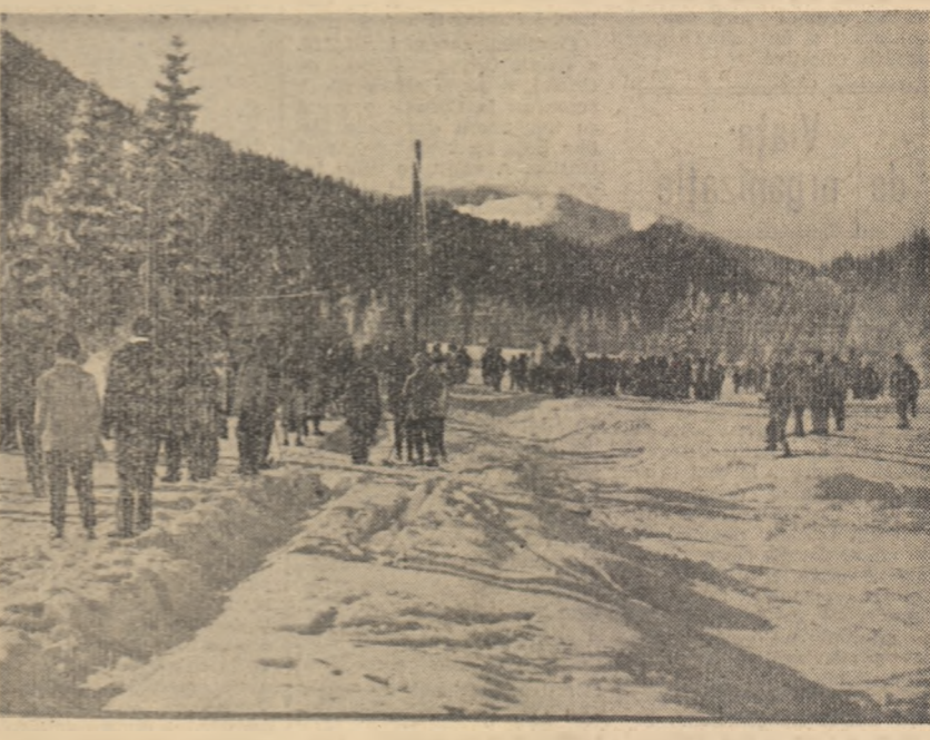
Zile „pline” la Poiana Brașov

Anul XVIII, seria II nr. 3937 6 PAGINI — 30 BANI Vineri 12 ianuarie 1962