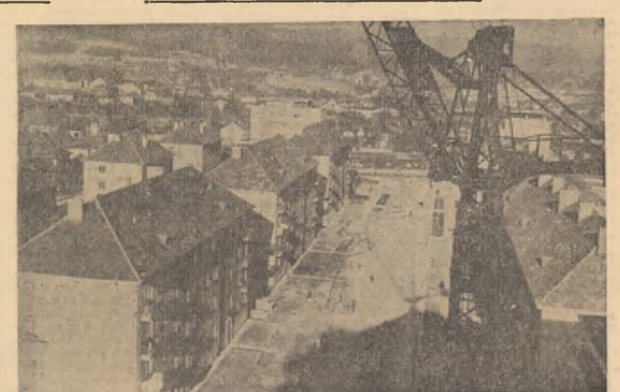
R. S. Cehoslovacă: Clădirea din cele 1340 de apartamente moderne construite într-o suburbie a orașului Jihov

O.N.U., a spus în încheiere V. A. Zorin, trebuie să aibă un rol pozitiv în rezolvarea practică a problemelor dezarmării, în înfăptuirea măsurilor de întărire a păcii generale, în stabilirea colaborării internaționale în diferite domenii. În ultimul timp, guvernul sovietic a depus eforturi susținute în vederea stabilirii acestei colaborări și pentru rezolvarea prin tratative a problemelor litigioase care creează disensiuni între țările noastre. Ne exprimăm speranța că și guvernul S.U.A. va contribui la aceste eforturi pentru a lichida împreună încrederea internațională periculoasă, principalele cauze ale acestei încordări și a asigura coexistența pașnică a statelor cu sisteme sociale diferite.