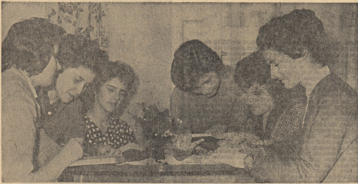
Peste trei zile încep examenele în facultăți. Nici o alipă nu mai poate fi pierdută. La Câmbul nr. 1 al Universității „C. I. Parhon” din București studenții, în grupe de învățare, repetă până la noaptea materia.

La Institutul de fibre artificiale și sintetice din Lodz, colectivul condus de inginerul principal W. Sopena lucrează la perfecționarea fibrelor artificiale produse în Polonia. În ultima vreme au început experimente în domeniul tehnologiei producției de fibre din alcool polivinilic. Se poate spune de acum că acestea vor fi cele mai ieftine fibre sintetice produse până acum. Ele vor costa mai ieftin decât bumbacul. Noile fibre sint extrem de rezistente atât în stare uscată cât și umedă; sint rezistente la acțiunea substanțelor alcaline a compozițiilor organici și a apei de mare; nu putrezesc și nu se uzază prin frecare. Ele pot fi folosite în loc de bumbac la producția de țesături, precum și pentru țesături de cord folosite pentru anvelope, plase de pescuit, odgoane etc.