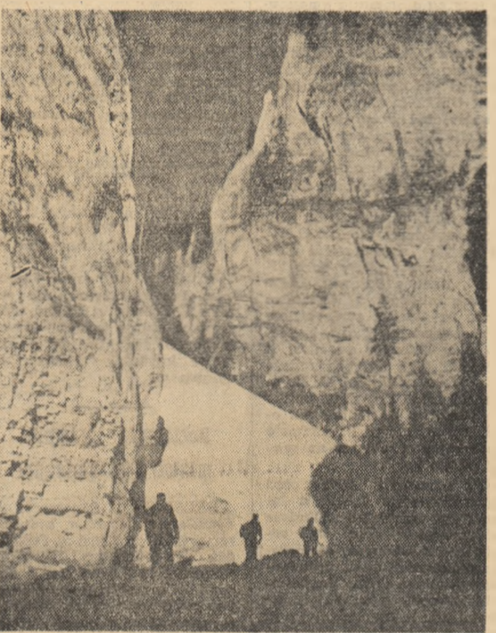
Un drum piatră silincile din Piatra Craiului îi oferă asemenia priveliști încântătoare.

Producțiile de lapte pot să crească și mai mult, iată ce sînt la baza exploatării pe care le fac cașcătoarii Bazei experimentale de la Fundulea, de pe lângă I.C.A.