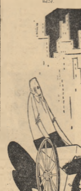
— Aci o fi... Departamentul de stat ???

Sub președinția masei populare din Republica Dominicană, Balaguer a fost nevoit să demisioneze.