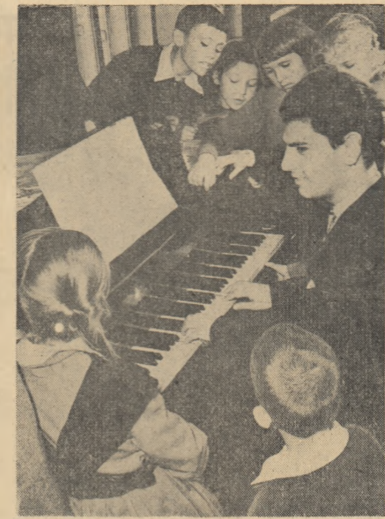
La „Clubul tineretului” din Telnograd (U.R.S.S.) fiii oamenilor muncii se instruiesc, printre altele, si in domeniul muzicii