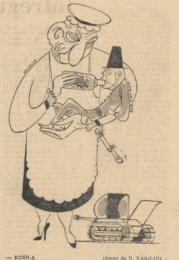
(desen de V. VASILIU)

R.F.C. a hotărît trimiterea unui ajutor lui NGO DINH DIEM, în valoare de 12.500.000 dolari.