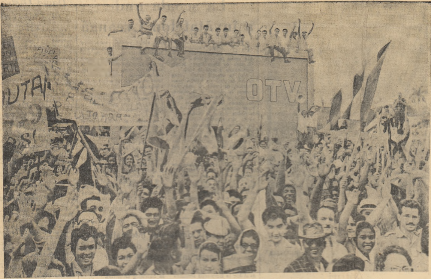
Poporul liber al Cubei este hotărât să-și opere vizita sa nouă