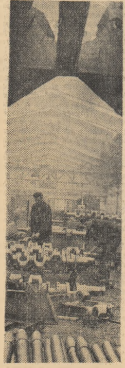
Aspect din secția motoarelor „23 August” din Capitală