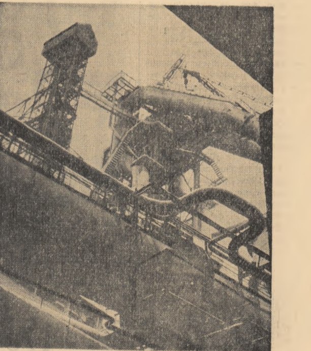
Furnalul Nr IV al ofelărilor „V. I. Lenin” de la Nova Huta care a intrat recent în funcțiune este unul dintre cele mai mari furnale din R. P. Polonia

DECAZEVILLE 22. — Corespondentul Agerpres transmite: Cel 860 de mineri care s-au alăturat galeiilor din Decazeville de 35 de zile, continuă lupta. De la primele întâlniri cu locuitorii importanți în centru minier situat în departamentul Aveyron, din sudul Franței, la aproximativ 700 de kilometri de Paris, mi-am putut da seama că întreaga lume de aici — muncitorii, comercianții, țărani, liber profesioniști — sînt solidari cu lupta minerilor. Totuși nu vorbește decît de aceasta.