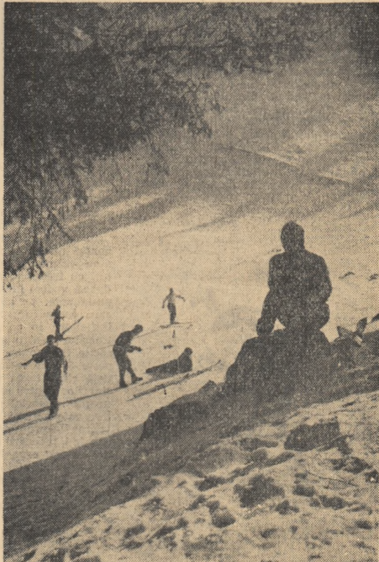
Muntele și-a primit și de data aceasta oaspeții cu mult scare și... zăpădă buna de schi.