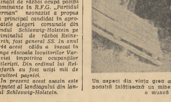
Un aspect din viața grea a minerilor japonezi. Fotografia noastră înfățișează un miner concediat nouelt și prezente o muncă necălită

BONN 25 (Agerpres). — Criminalii de război ocupă poziții dominante în R.F.G. „Partidul german” neonazist a propus ca principal candidat în apropierea alegerii comunale din landul Schleswig-Holstein pe criminalul de război Reinhard, fost general SS. În anul 1944 acest călău a înecat în singe răscoala locuitorilor Varșoviei împotriva ocupațiilor hitleriste. Din ordinul lui Reinhard au fost uciși mii de locuitori pașnici.