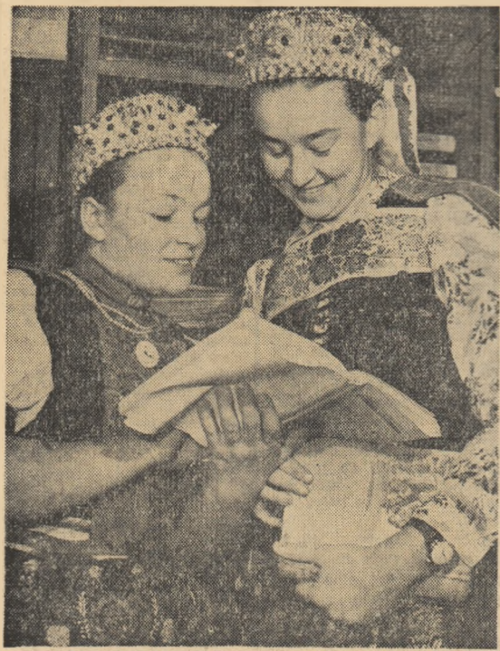
La biblioteca căminului cultural din comuna Izvoiu Crîșului, raionul Hușid, regiunea Cluj