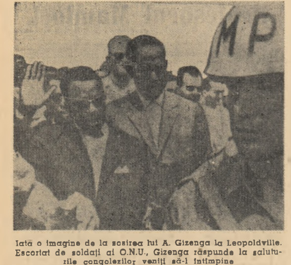
Iată o imagine de la soseala lui A. Gizenga la Leopoldville. Escortat de soldați ai O.N.U., Gizenga răspunde la salutarile congolezilor veniți să-l întâmpine

Mulele cere opiniei publice mondiale să ia atitudine hotărîtă în apărarea lui Antoine Gizenga și declară că răspunderea pentru securitatea lui revine ONU.