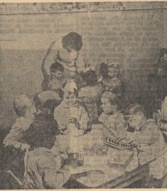
Copilarie însoțită (aspect de la grădinița cu orar normal de pe lângă Uzina „Oțelul Roșu”)

Desigur, rînda studenților se verifică în sala de examen. Dar ea se vedește și într-o sală de lectură, și într-o cameră de cămin, în fiecare moment și pretutînd unde este pregătit examenul. În aceste zile și seri ale sesiunii, căminele studențești, bibliotecile studențești, bibliotecile studențești din Galați cunosc o atmosferă de lucru intens, creată de sute de studenți. În condiții mereu îmbunătățite, studenții învață și se prezintă în fața examenatorilor cu dorința vie și hotărîrea neîstrămutată de a obține acele rezultate care să însemne transformarea în fapt a îndemnul adresat de partid de a-și însuși cunoștințele la necesitățile exigențelor înalte ale economiei și culturii socialiste.