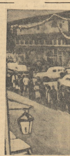
În orașul american Albany (statul Georgia) a avut loc un de mult o puternică demonstrație a populației de culoare împotriva discriminărilor rasiale din S.U.A.

În Germania occidentală este înrădăcinată ideea că școala este menită să creeze premisele ideologice ale unor noi aventuri războinice. Generalul american Howley a cerut profesorii vest-germani să nu formeze „oameni culti”, ci „asasini”, pentru că „numai asasinii pot câștiga bătăliile”. Ministrul de Război, Strauss, a cerut „contacte cît mai strînse între armată și școală”, subliniind necesitatea educării unor „luptători individuali în războiul psihologic”.