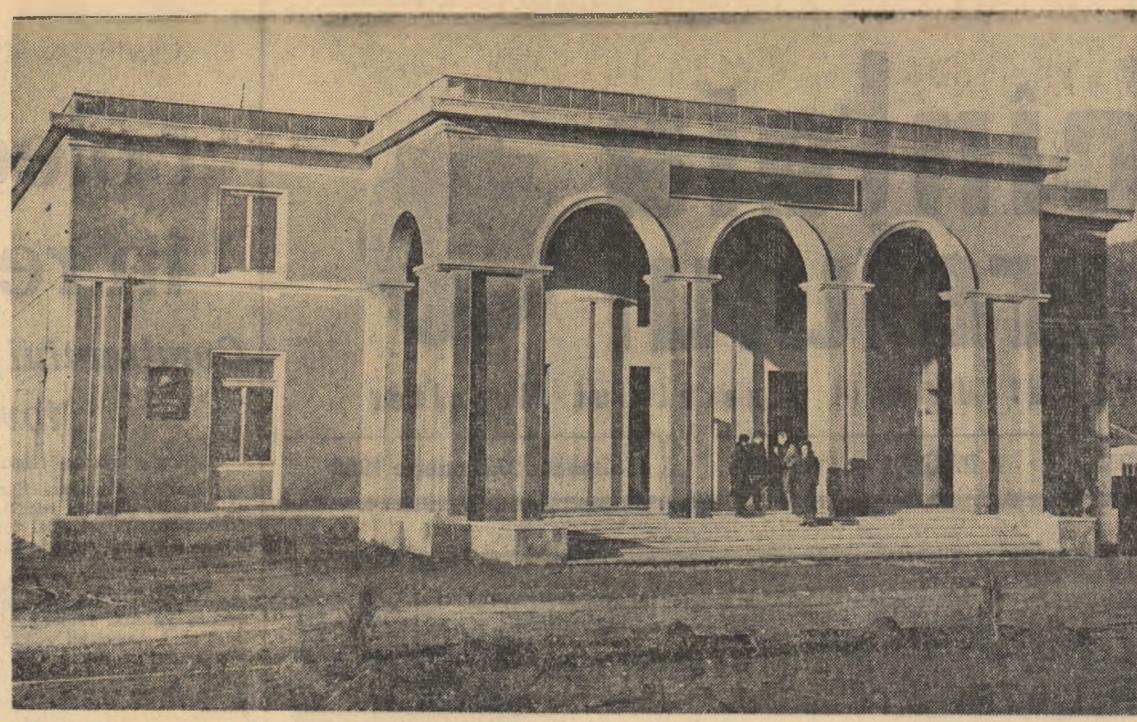
Casa de cultură din Vaslui, regiunea Chișina dată în folosință în anul 1961. Casa de cultură este dotată cu o sală de spectacole cu 300 de locuri.