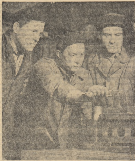
De respectarea planului de operații depinde în bună măsură calitatea produselor. Așezându-se la masă, responsabilii unei brigăzi de producție de la secția mecanică a întreprinderii Mecanice din Roman discută acest lucru cu alți membri ai brigăzii.