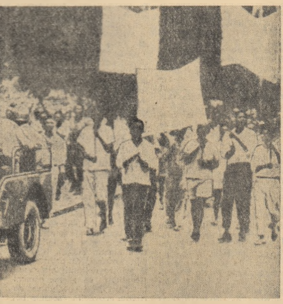
Fotografia de mai sus reproducută după ziarul italian „L'Unita” înfățișează un aspect din cursul unei demonstrații care a avut loc la Leopoldville în favoarea lui Glezos.

INTREBARE: Amiralul Holland-Martin a afirmat: „Vom lăsa flota rusă în Marea Neagră și o vom distruge. Dispunem de planuri pentru a preveni în caz de război ieșirea flotei ruse, prin strîmtoare, în Marea Mediterană”.