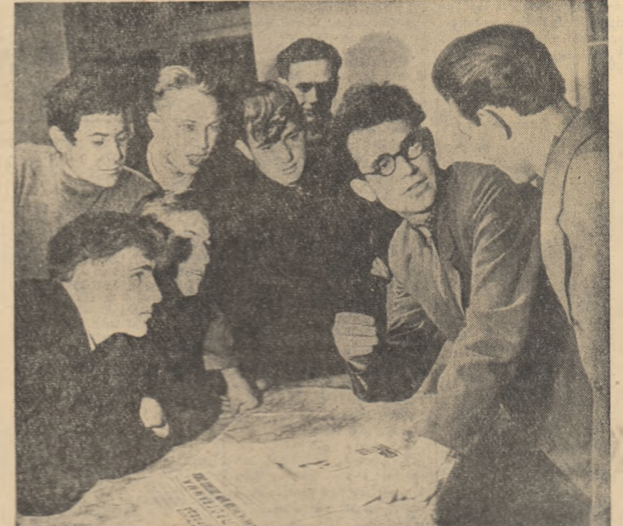
U.R.S.S. Un grup de elevi ai Școlii de mecanizare a agriculturii de la Buzovna...

zelești peste măsură posibilitățile de a face declarații provocatoare pe teritoriul Turciei și că le permit să se joace cu soarta acestei țări.