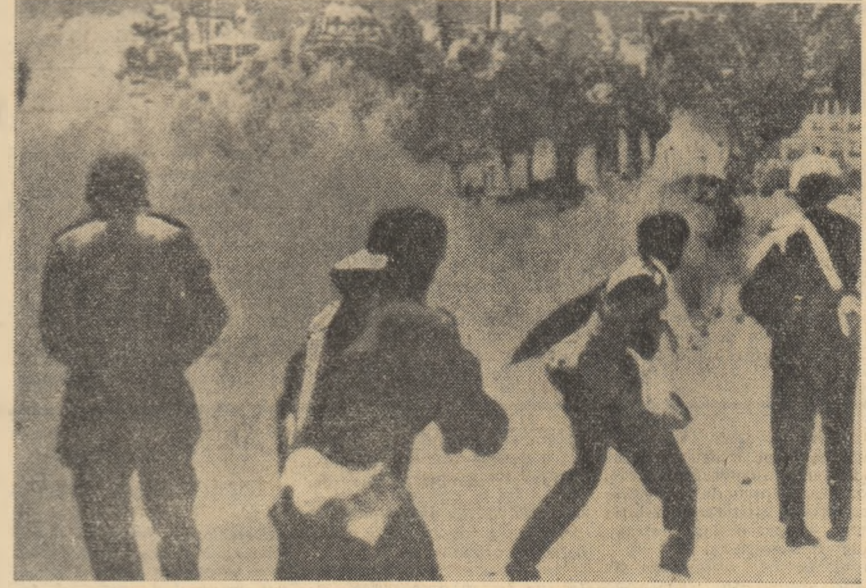
LA PAZ. Două imagini din timpul unei puternice demonstrații de solidaritate cu poporul cuban, care a avut loc în capitala Boliviei.