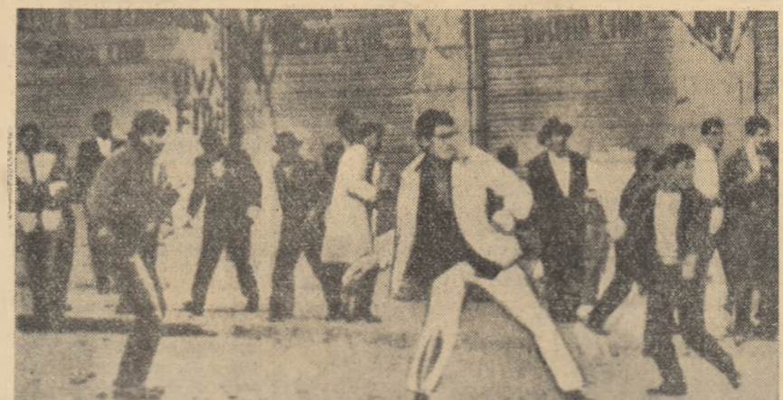
LA PAZ. Două imagini din timpul unei puternice demonstrații de solidaritate cu poporul cuban, care a avut loc în capitala Boliviei.