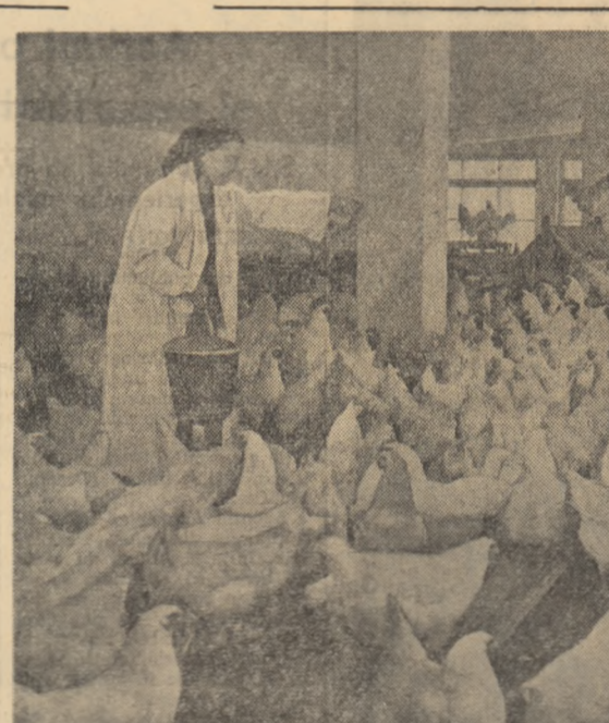
Mai multe ouă, mai multă carne de pasăre pentru piețele Capitalei. Una din marile unități agricole socialiste care furnizează aceste produse este și Combinatul agro-alimentar „30 Decembrie” de unde a fost lucrat imaginea de mai sus.