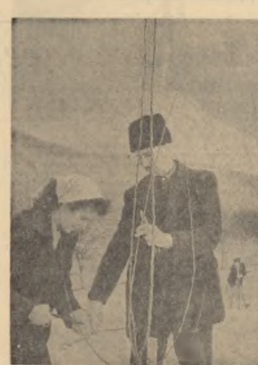
După lecșia tinută la cercul agrotehnic, verificarea practică a cunoștinșelor colec- tivilor din satul Buda, raionul Rm. Vlcea, cu trecul la curățitul merilor pitici din livada gospodăreșii.

Organizașia U.T.M., făcînd o largă popularizare cărșilor pe care le difuzează, îi ajută pe tinerii muncitori să se pre- gătească pentru dobîndirea in- signei de „Prieten al cărșii”. În anul trecut, perioadă cînd peste 1.800 de tineri ploieșteni au devenit purtători ai inșiei- nel „Prieten al cărșii” — or- ganizașia U.T.M. din oraș au difuzat în rîndul tineretului cărșii în valoare de 190.000 lei. Organizașia U.T.M. de la Fabrica „Dorobanșul”, Uzi- nolea „1 Mai”, Rafinaria „Plo- iești” și de la „Nodul de cale ferată” au fost fruntașe în a- ceastă acșione. Odată cu primele zile ale noului an organizașia U.T.M. din orașul Ploiești au început o nouă și importantă acșione de difuzare a cărșii la locul de muncă al tinerilor. Pentru primul trimestru organizașia U.T.M. din orașul Ploiești s-au angajat să difuzeze cărșii în valoare de 75.000 lei.