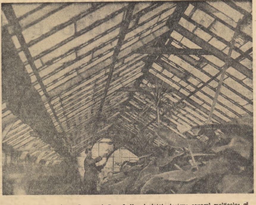
Ați vizitat în timp de vară orașul Deva? V-a închinat, desigur covorul multicolor al fîntînilor din spașiele verș. Știți unde-l locușilor lor de țară? În sera din care fotografia noastră vă înlăștează un aspect parțial. Aci lucrează și ulemistul Aurel Nicodău pe care fotoreporterul l-a surprins înșirînd cu mîglă flotele.