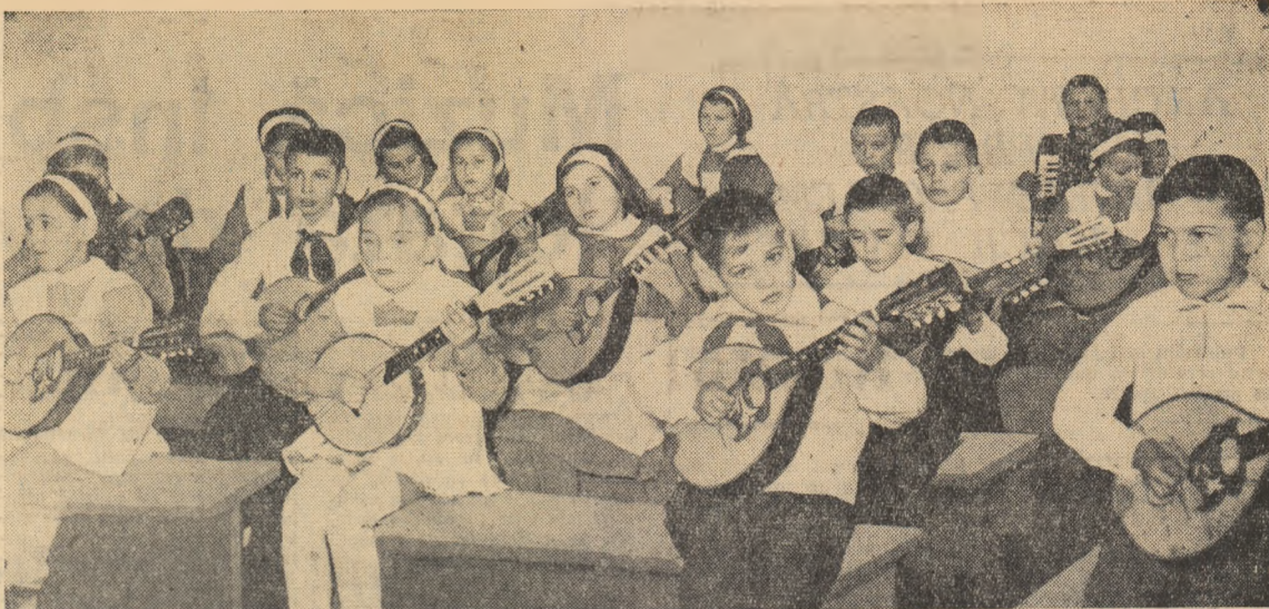
Orchestra de mandoline la repetiție