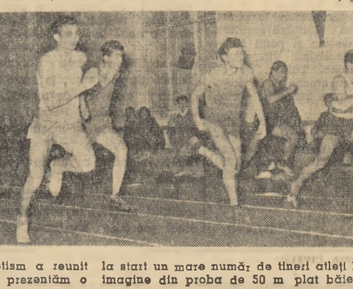
„Cupa 16 februarie” la atletism a reușit la start un mare număr de tineri atleți bucureșteni. În fotografia vă prezentăm o imagine din proba de 50 m plat băieți

Handbaliștii țigărești au desfășurat un joc echilibrat, cu multe schimbări de joc în atac și deși nici nu se aflau încă în posesia câștigătoare, în timpul jocului au reușit să marcheze un singur gol în meciul strins, au învins la limită. Scor final: 7-6.