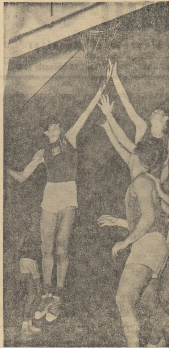
Un coș reușit. Lupta pentru balon se va declanșa cu și mai multă dinamică (fază din meciul de baschet: Rapid-S.P.C., disputat duminică dimineața în Capitală).

Atfel, s-au luat o serie de măsuri pentru ca aceste concursuri să se desfășoare în cele mai bune condiții. Pe lângă fiecare centru de comună, unde sînt programate întrecerile, a fost delegat câte un membru din comisia raională, care va îndruma și sprijini colectivul de organizare locală. Se va intensifica activitatea de popularizare a întrecerilor Spartachiadei prin afișe, stăluțe de radiorolare și prin articole la gazetele de la căminele culturale. De asemenea, o serie de sportivi frunziși din