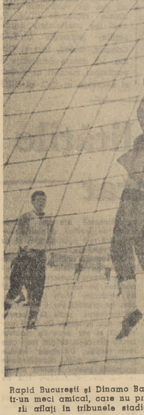
Rapid București și Dinamo Bacău s-au întâlnit duminică într-un meci amical, care nu prea l-a „încălzit” pe spectatori aflați în tribunele stadionului acoperit de zăpadă

Handbaliștii țigărești au desfășurat un joc echilibrat, cu multe schimbări de joc în atac și deși nici nu se aflau încă în posesia câștigătoare, în timpul jocului au reușit să marcheze un singur gol în meciul strins, au învins la limită. Scor final: 7-6.