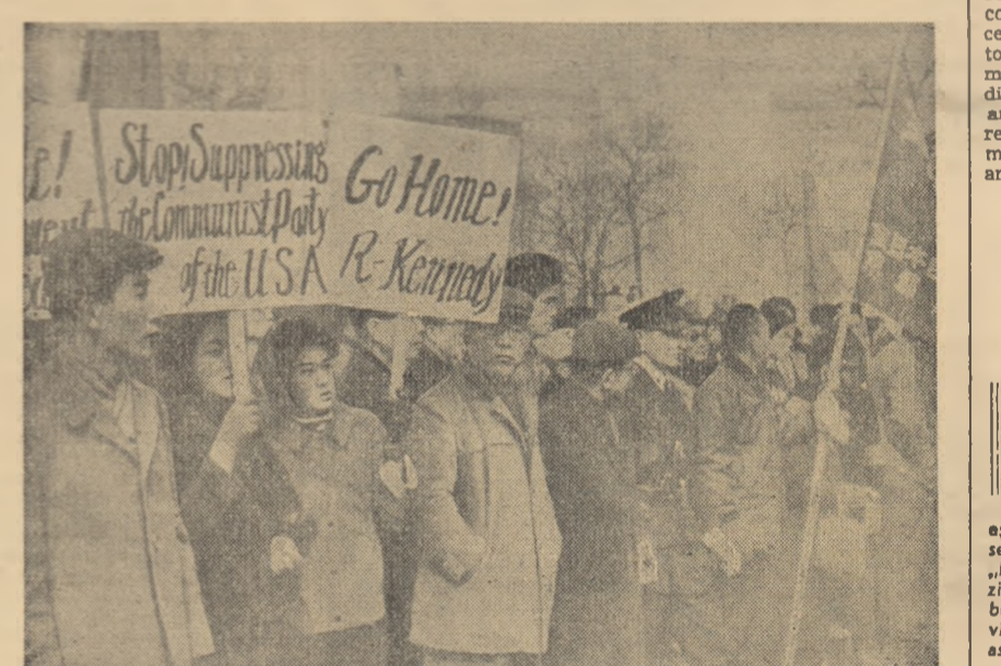
Aspect de la una din manifestările de protest împotriva vizitei în Japonia a ministrului Justiției al S.U.A., Robert Kennedy

„Fără îndoială — scrie revista — trebuie să pornim de la premiza că populația va trebui să plătească impozite foarte mari pentru acoperirea cheltuielilor militare. Și nu există nici o garanție că aceste impozite nu vor deveni și mai mari în anii viitorii“.