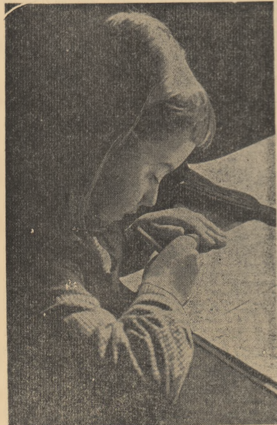
Primii pași în studiul au început sub semnul deplinii seriozității...