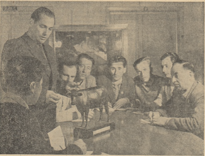
În comuna Bradu-Pitești funcționează o școală pentru pregătirea cadrelor din G.A.C. Fotografia noastră vă prezintă un aspect de la o lecție de zootehnie.