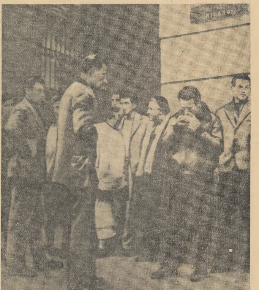
O imagine obișnuită nu numai pentru Italia unde este fotografia făcută, ci pentru întreaga lume capitalistă, unde flăgelul șomajului lovește crunt în tînăra generație. Tinerii muncitori din Milano așteaptînd în fața oficiului de plasare. Ei speră să găsească ceva de lucru, fie chiar și temporar.

„Washingtonul face planuri în acest timp șomerii nu pot găsi de lucru”. Aceste cuvinte cu fast spusă luna trecută unui redactor al revistei americane „Look” de unul din șomerii care făceau coadă în fața unui oficiu de plasare din orașul Toledo. Într-adevăr, șomerii — în rîndurile cărora zărești a descopești numeroase fețe tinere — s-au săturat de atîtea planuri și de... pronosticurile favorabile privind viitorul economiei americane. După cum a scris dl Chandler Brossard, redactor al revistei „Look” — în concluziile la o anchetă privind șomajul în rîndurile tineretului american, peste tot unde a fost, în orașe și ferme agricole, la uzine și la oficiile de plasare, în țara lui s-a prezentat același tablou sumbru și lipsit de speranțe. „Tinerii americani — a criticat revista „Look” — rătăcesc pe drumurile Americii. Viitorul lor este întunecat”.