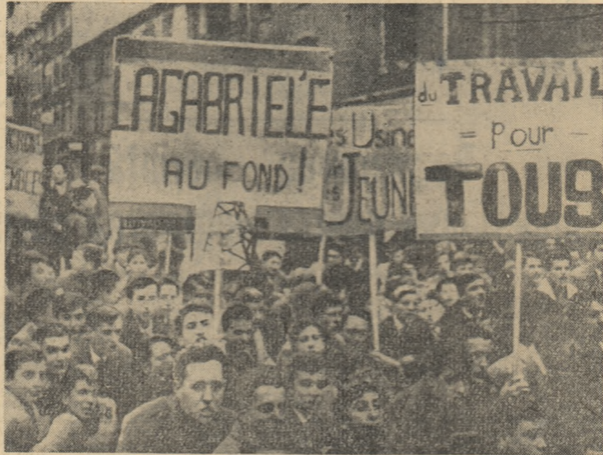
„Du travail pour tous” (De lucru pentru toți) scrie pe pancartele purtate de tinerii mineri din Decazeville la una din demonstrațiile ce s-au desfășurat recent.

spus: „Învăț în prezent, cu mari greutăți, într-o școală tehnică. De doi ani am văzut cum promoția mea se împuținează tot mai mult. La început eram 15, acum nu am mai rămas decât doi. De cîrind am înțeles din dîntre foștii mei colegi. Ei muncesc ca manipulanți într-o uzină”. Acesta este așadar viitorul tinerilor francezi din această regiune. Cînd, cu greu, reușesc să găsească de lucru, cu toate că au învățat în școli, primesc posturi de muncitori necalificați. În zilele grevei eroice de la Decazeville tinerii din această regiune au luptat cot la cot cu minerii pentru dreptul la muncă. Peste 5.000 de tineri muncitori au demonstrat în orașul Decazeville cu pancarte pe care era scris: „Tineretul este alături de mineri”. „Să se dea de lucru tinerilor”. A fost una din demonstrațiile solidarității oamenilor muncii francezi care se ridică tot mai mult în lupta împotriva patronilor, împotriva mizeriei și șomajului, pentru piine și locuri de muncă.