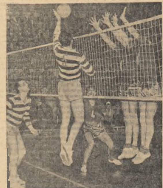
Mingea va reuși să treacă totuși peste blocajul prompt al voleibaliștilor din Moscova. O țară din meciul de volei Progresul București-T.S.K.A. Moscova.