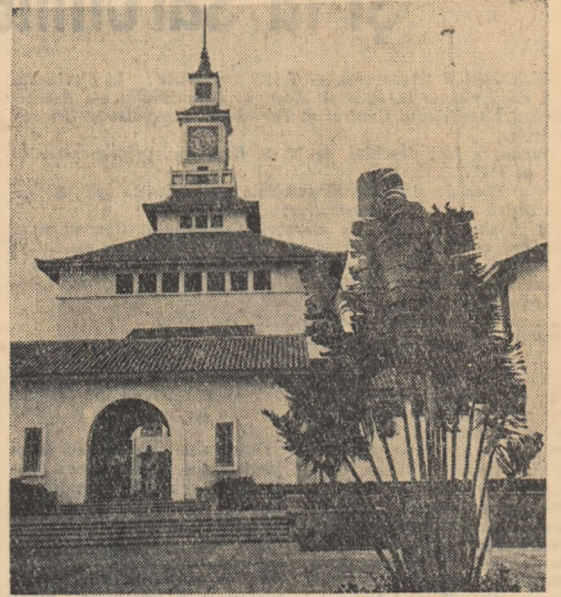
Imagine din capitala Republicii Ghana — Accra: clădirea bibliotecii Universității.

Implinesc cinci ani de cînd poporul ghanez și-a cucerit independența națională, eliberîndu-se de sub jugul colonialistilor englezi. Ghana este una din primele țări din Africa care și-a câștigat independența națională prin lupta hotărîtă a poporului său împotriva colonialismului, în condițiile avîntului general a mișcării de eliberare ce a cuprins în anii postbelici continentalul african.