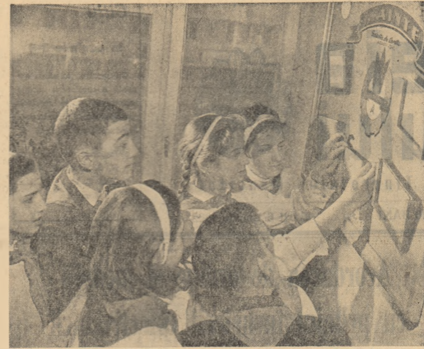
Pionierii de la Școala de 8 ani nr. 175 din Capitală așteaptă întotdeauna cu interes apariția noilor numere ale gazetei de perete