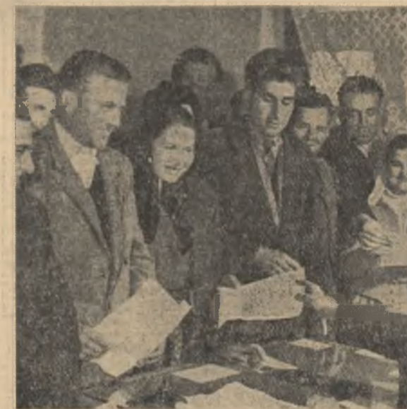
Convinsi că drumul arătat de partid este drumul fericirii și al bunăstării, jărîmni muncitori din Prundeni, raionul Drăgășani, regiunea Argeș, depun cereri de înscriere în gospodăria agricolă colectivă.