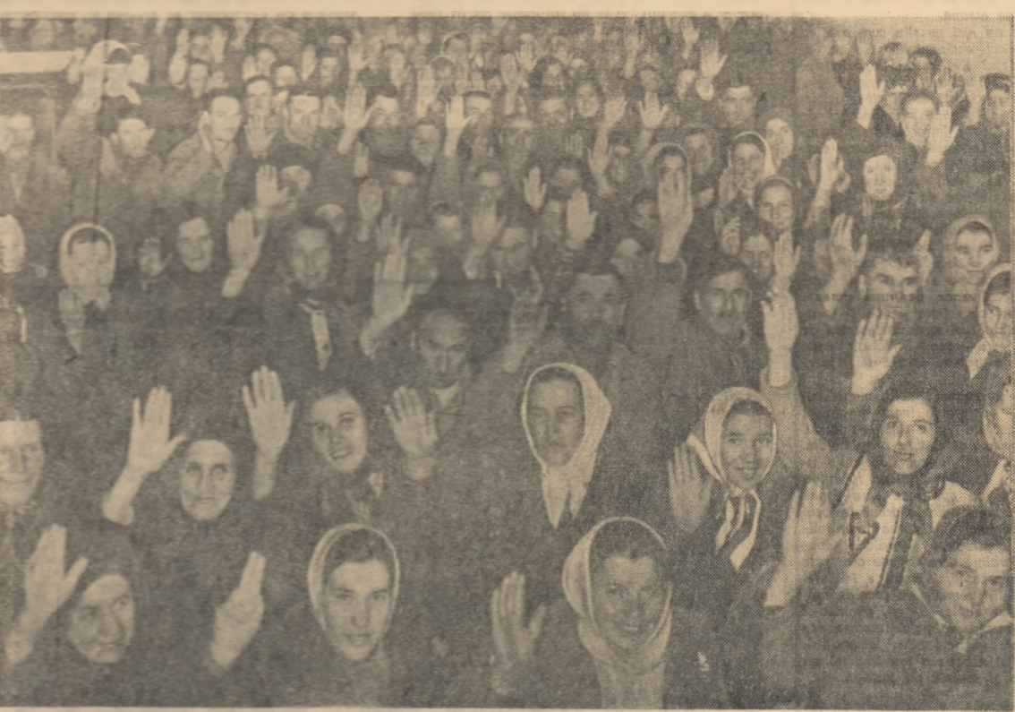
Zilele trecute la G.A.C. din comuna Horia, raionul Roman, a avut loc o adunare generală a colectivistișilor pe care toți oamenii din sat au așteptat-o cu multă nerăbdare: s-au primit cu această ocazie la gospodăria colectivă ultimele familii. Pădurea de mîini care se ridică de fiecare dată cînd se vor o nouă cerere le-a vorbit noștor înscrisi despre marea dragoste cu care sînt primii în familia colectivistișilor.

Noi elevi la școala belșugului La gospodăria agricolă colectivă din satul Tabăra, regiunea Iași, funcționează două cercuri agro-zootehnice. La început, la primele lecții, au participat numai 65 de colectivisti. Cînd însă numărul elevilor la această școală a belșugului a ajuns la 200. Aceștia nu pentru că cei ce răspund de mobilizarea cursanților la lecții nu l-au înscris pe toți de la început. Nu! Cei ce au luat lecții mai tîrziu în bancă sînt țărani muncitori tineri și stîrșnici care s-au înscris de surînd în gospodăria colectivă și care și-au manifestat dorința să învețe agro-tehnică. Toți cursanții participă cu regularitate la lecții și la demonstrațiile practice. Aplicînd în practică cele învățate la cursuri, colectivistișii au amenajat răsăd-nițe pentru cele 11 hectare de grădină, au selecționat semințele de legume și zarzavaturi, au transportat importante cantități de îngrășăminte naturale pe cîmp. Sînt măsuri care asigură obținerea unor recolte bogate în acest an. MIHAI LUCA corespondent