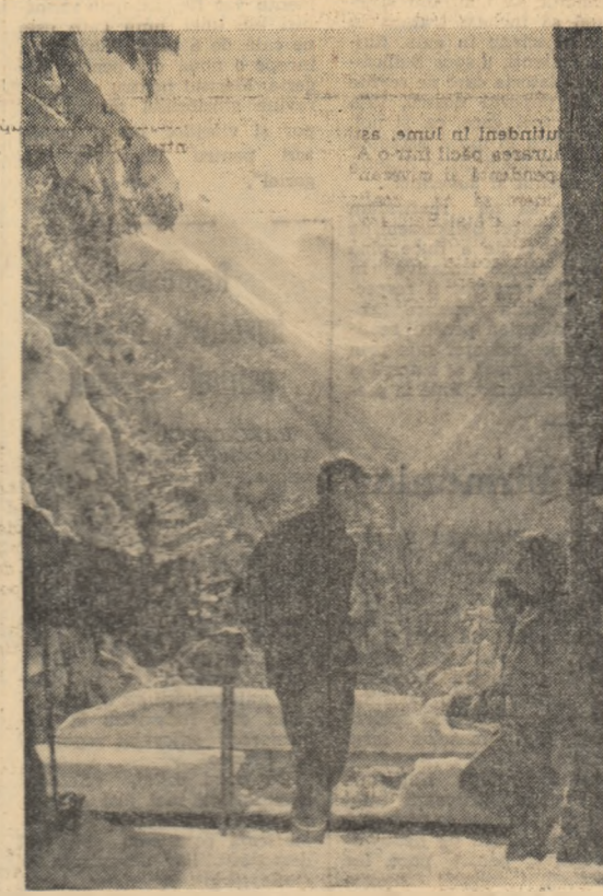
În drum spre cabana Bilea-Cascadă, o minunată priveliște a culmilor Făgărașilor.

În încheierea dezbaterilor lucrărilor conferinței a luat cuvîntul tovarășul Octavian Nistor, membru supleant al Biroului C.C. al U.T.M. care