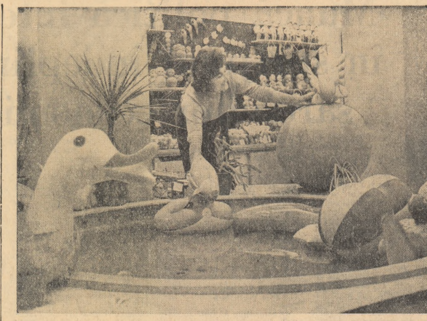
Micușii moscoviți li s-a pus la dispoziție un mare magazin pentru vânzarea jucăriilor. În fotografie o imagine din sala jucăriilor plătitoare.

Turneul lui Robert Kennedy a cuprins Japonia, Taiwanul, Indonezia, Thailanda, Vietnamul de sud, India, Berlinul occidental, R. F. Germană, Italia, Olanda, Franța, La ple-