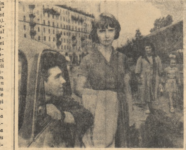
O producție în două serii a studioului „Mosfilm” după romanul cu același nume al Galinei Nicolaeva.