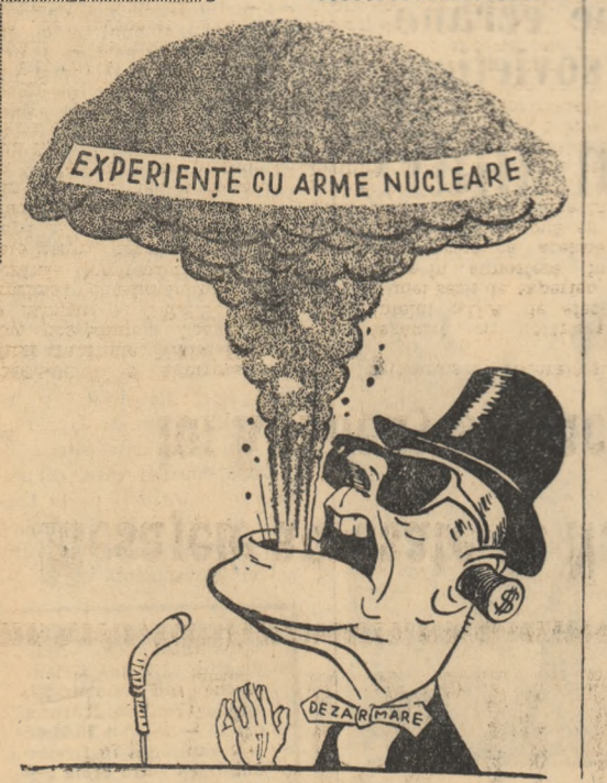
Încă o „contribuție” americană la dezarmare.

gînd: „Voi, indonezienii sînteți nechibzuți gîndind că America s-ar putea opune olandezilor”. Desigur că Robert Kennedy nu a avut în vedere relațiile stabilite de primii emigranți olandezi din spîta Mayflower sosiți în America în urmă cu cîteva secole din care se trage actuala aristocrație a S. U. A., ci legăturile mult mai concrete și mai actuale ale S.U.A. cu Olanda în cadrul N.A.T.O. Declarațiile făcute în Olanda, deși mai reținute în urma „experienței” căpătîință datorită replicii opiniei publice indoneziane, au confirmat aceste legături.