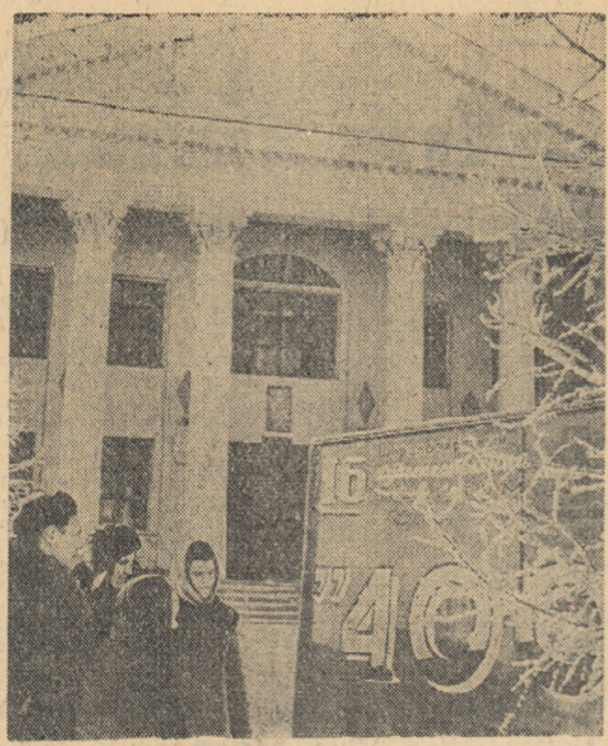
U.R.S.S.: Sovhozul cerealier „Kutancald” din regiunea pămînturilor deșelante dispune de un frumos Palat al Culturii. În timpul liber tinerii muncitori sînt nelipsiți de la numeroasele manifestări culturale care se desfășoară aici.

Greutățile vor fi biruite, a declarat N. S. Hrușciov. Avem o industrie bună, o știință avansată, cadrele noastre sînt capabile să îndeplinească cele mai mari și cele mai complexe sarcini.