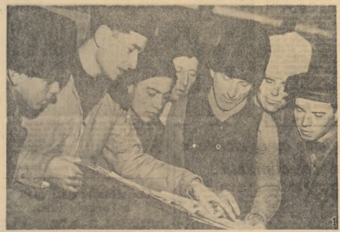
Cojocna. O comandă din regiunea Molea, regiunea de agricultură colectivă...