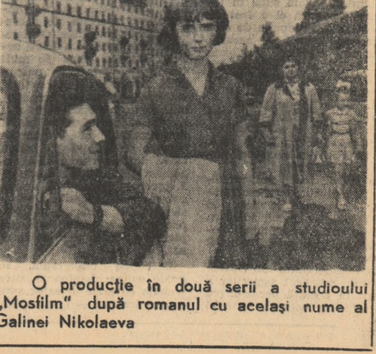
O producție în două serii a studioului „Mosfilm” după romanul cu același nume al Galinei Nikolaeva