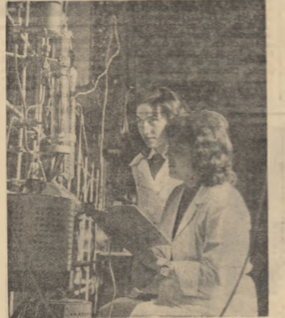
Lucrări practice într-unul din laboratoarele Institutului de petrol, gaze și geologie din București

Cercul de poezie „Tudor Arghezi” de la Facultatea de filologie din București și-a reînnoit marile serale de poezie cu referență la lucrări (ceea ce e determinat cîteodată ca profesorii să-i rechemă, cu o altă grupă), se plimbă de la un aparat la altul, stau de vorbă sau execută în mod superficial temele date.