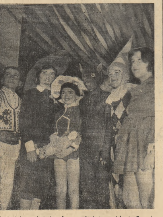
În cadrul manifestărilor din vacanță, ieri a avut loc la Casa de cultură a tineretului din raionul 23 August, un frumos carnaval al pionierilor la care au participat numeroși pionieri și elevi din raion. În fotografie un aspect din timpul carnavalului.