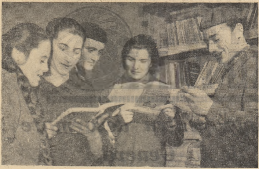
În fotografia: biblioteca secției reparații mecanice de la Fabrica de rulmenți Birlad

Deosebi, la lumina becului electric, în casele noi, frumoase mobile, la poartă, se pot vedea pe locuitorii rînduri ori ascultînd radioul. Satul nostru este radiofon, iar uzina sa electrică deservise încă șase sate învecinate. Acesta este satul meu, în care se simte în permanență grija partidului pentru a asigura locuitorilor săi o viață civilizată, pe măsura venimilor pe care le trăim.