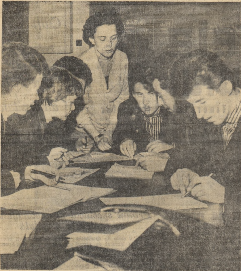
O grupă de intrajurătorii la Institutul de mine din Petroșani