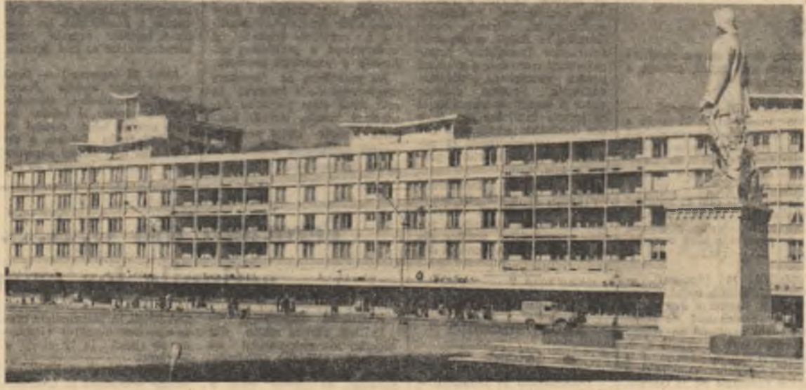
Locuințe noi la Baia Mare

Acestea sînt doar cîteva aspecte din activitatea unor organizații U.T.M. din orașul Ploiești privind desfășurarea acțiunilor de muncă patriotică. Anul acesta tineretului ploieștean îi revin sarcini mari privind dezvoltarea și înfrumusețarea orașului lor. Iată cîteva din obiectivele concrete pe care comitetul orașenesc U.T.M. le-a stabilit în colaborare cu șeful popular orașenesc. Tinerii vor amenaja parcul din fața „Școlii de Muncă” precum și parcul tineretului situat la intrarea în oraș, pe drumul spre stația de autobuz. În ambele parcuri vor fi plantați circa 13.000 arbuști și pomi, vor fi amenajate alei, ronduri cu flori etc. Tot tinerii le-a fost încredințată sarcina de a participa la construirea a două școli, la lucrări de demolare și la pavarea unor străzi. În anul acesta tinerii ploieșteni vor colecta cantitatea de 15.000 tone fier vechi și vor participa la sprijinirea lucrărilor agricole din noile G.A.C. Se prevede ca valoarea economică realizată prin aceste acțiuni de muncă patriotică să fie de circa 3.000.000 lei. Activitatea desfășurată pînă acum, experimentată pînă în domeniul organizării acțiunilor patriotice îl obligă pe tinerii ploieșteni, mobilizați de organizațiile U.T.M. să se archie cu cinste de noile sarcini, spre dezvoltarea și înfrumusețarea continuă a orașului lor drag.