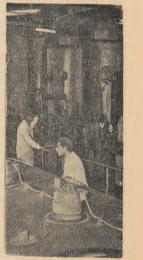
Aspect din noua secție a Fabricii de ulei din cadrul Combinatului de zahăr și ulei „Oltenia” — Podari.