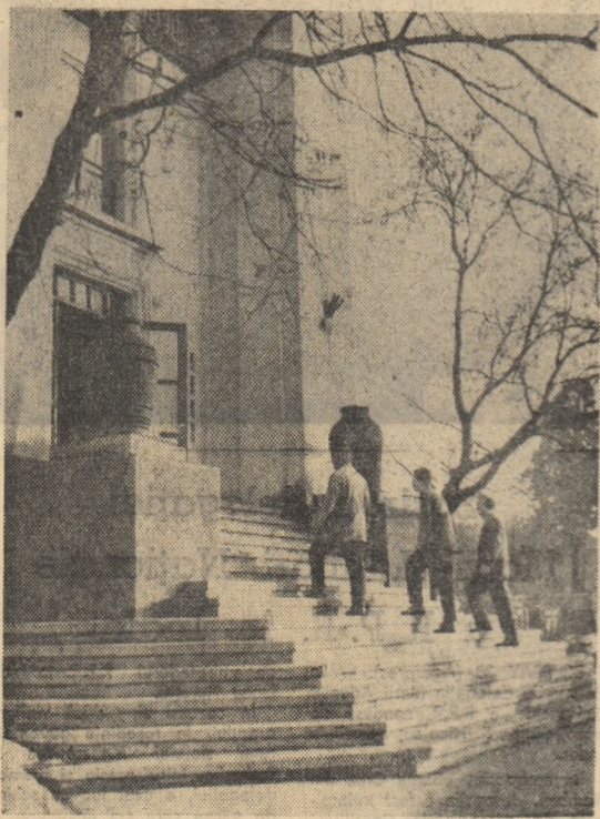
„Spre Casa de cultură a tineretului” (fotografia executată de tov. NASTASE ION, membru al cercului foto al Casei de cultură a tineretului, raionul N. Bălcescu-București).

Organizat în cinstea aniversării a 40 de ani de la crearea U.T.C. din România