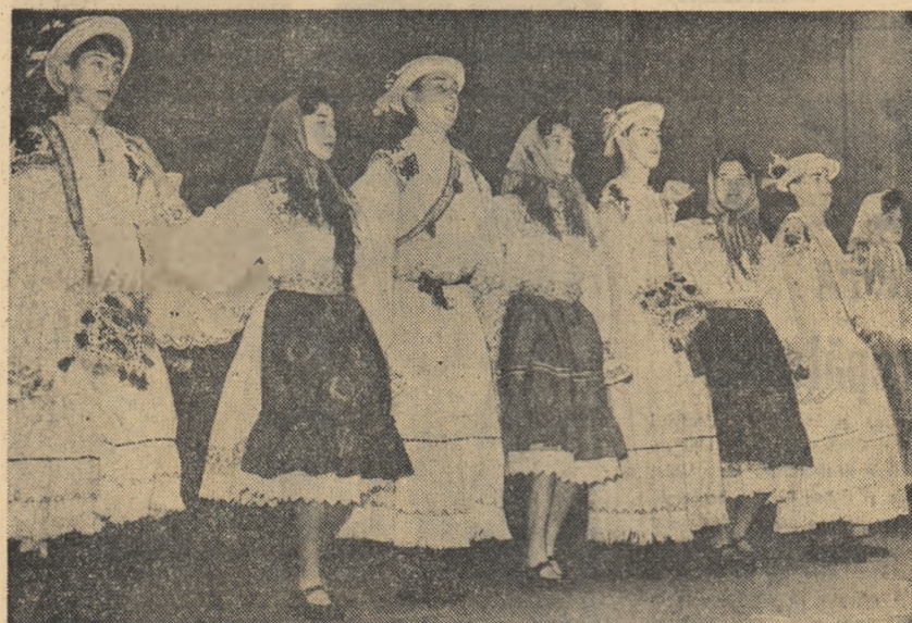
Dans din Oaș executat de echipa de dansuri a Școlii medii nr. 27 „Victor Babeș” din Capitală.

troliștii din cadrul regiunii a IV-a I.T.C. — Oltenia, de pildă, au realizat, în primul trimestru al acestui an, economii la prețul de cost în valoare de aproximativ 2.000.000 lei. De asemenea, desfășurînd larg întrecerea socialistă, colectivul secției construcții și montaje din schelele petrolifere Tîlceni a devenit fruntaș pe întreaga schemă. Printre altele, această secție a făcut de la începutul anului și pînă acum, economii la prețul de cost în valoare de 185.000 lei.