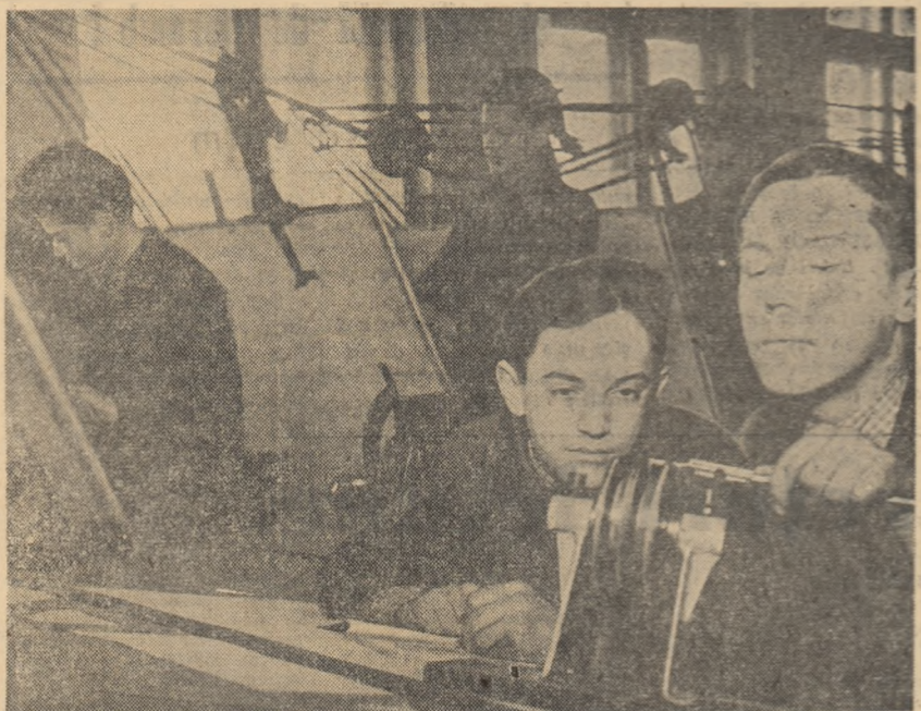
Grupul școlar minier Petroșani. Oră practică în sala de desen tehnic.