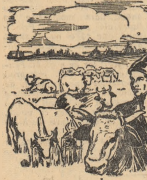
Un grup de tineri colectivști din comuna Blejoiu, lucrînd la întreținerea pășunii de pe lînzul comunal.

Un grup de tineri colectivști din comuna Blejoiu, lucrînd la întreținerea pășunii de pe lînzul comunal.