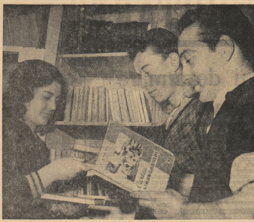
La biblioteca tehnică a Uzinei „Independența” din Sibiu.