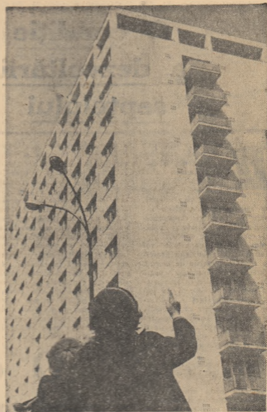
„Vezi, acolo locuiesc eu!” (Fotografie primită de la cercul foto al Casei de cultură a tineretului din raionul „30 Decembrie” din Capitală).

O condiție a dezvoltării șeptelului Baza furajeră