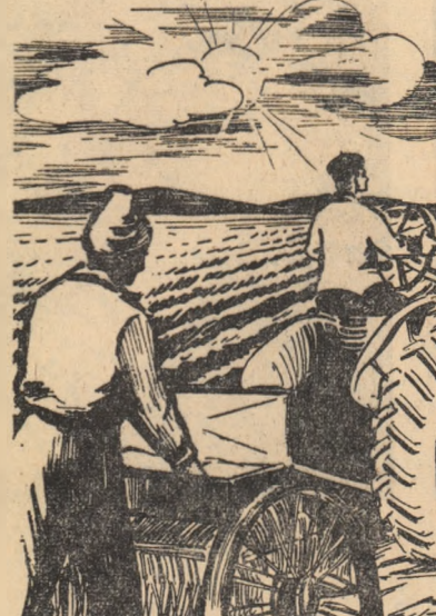
hogat în proteine. În prezent toate culturile sînt seminate, în afară de porumb. Ceea ce ne bucură, este faptul că deși timpul nu a fost prielnic, am reușit, totuși să efectuăm însămînțatul acestor culturi într-un timp scurt. Cum s-a procedat? Brigada a fost organizată în trei echipe. Sub conducerea or-

Speciații au stabilit că pe asemenea pășuni trebuie făcute îmbunătățiri de suprafață (adică curățiri, îngrășări etc.). Prima experiență și cea mai simplă s-a făcut anul trecut. A fost doar o încercare, dar care a dat rezultate foarte bune. Terenul acesta de 110 ha a fost curățat de burueni, de pietre și cloate (acțiunea la care au luat parte numeroși tineri din Blejoiu) și a fost îngrășat cu o cantitate de 300 kg azotat de amoniu la ha. Atît și nimic mai mult, iarba a început să crească altfel decît în alți ani. Era mai bogată, pășunea pînă un covor dens și uniform. Producția de iarbă a fost de 29.000 kg la ha; de peste 36 de ori mai mult ca pînă acum. Oamenii din Blejoiu și din Ploiești, cei care își pășunau vitele aici de mulți ani s-au mirat de bogăția ierburii de pe pășunea lor și de sporul de lapte pe care îl obțineau acum