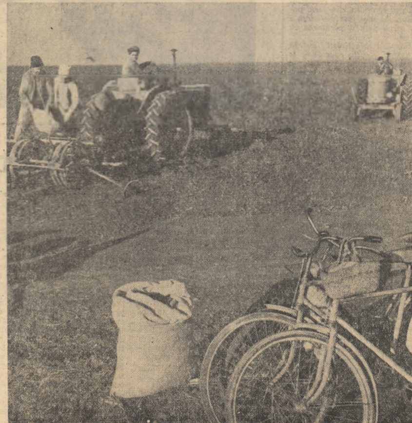
Fiecare oră bună de lucru este folosită din plin de către colectivități din Drîdu, raionul Urziceni.

Folosiți din plin fiecare clipă de timp prielnic pentru însămîntarea porumbului!