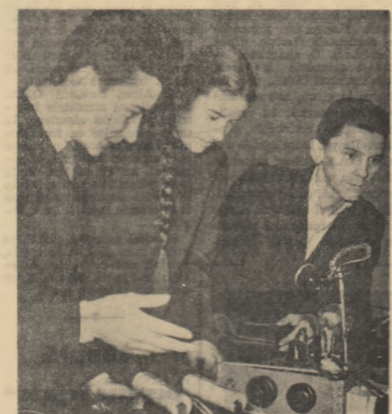
Elevii Școlii medii nr. 1 din Săbui au amenajat o expoziție cu materiale didactice executate de ei.

porumbel: V. Roșiță; Face nouli venit: Unirea; Nu e loc pentru animale săbatice: T. Vladimirescu; Vizita președintelui: Munca; Procesul maimuțelor: Popular; Casa surprizelor: Artă; Artistul: Moșilor, Drumul Serii; În noaptea de ajun: 16 Februarie; Sonate: 8 Mai; Nana: G. Bacovia.