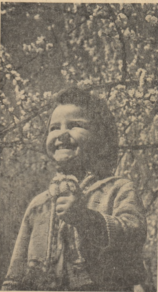
Flori de primăvară.