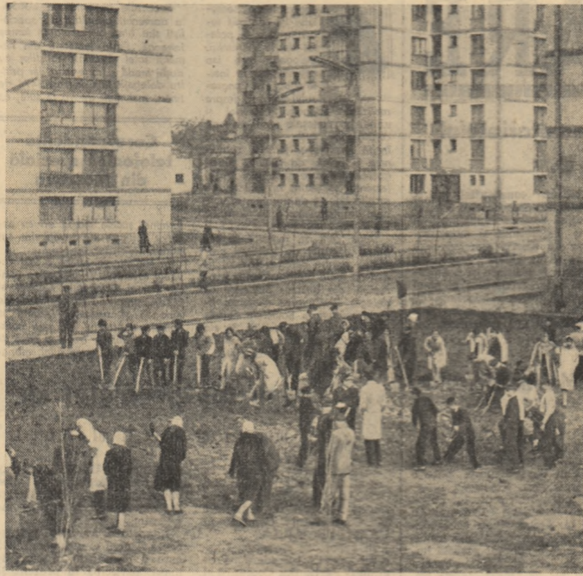
Tinerii galățeni lucrează la amenajarea unor spații verzi.