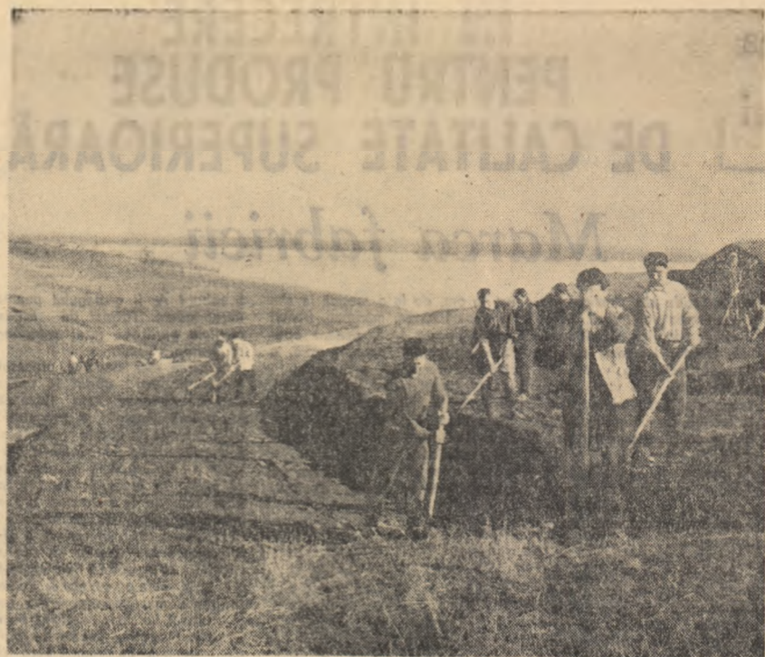
Dealurile sterpe, erodate vor deveni roditoare. Colectiviștii din Greaca, regiunea București, le terasează și le plantează cu viță de vie.