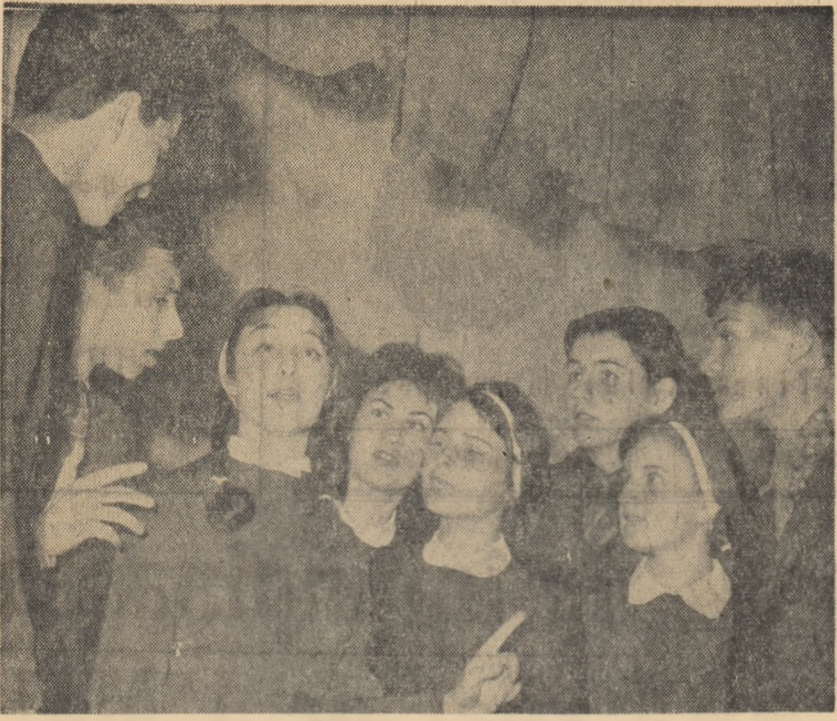
La o repetiție a brigăzii artistice de agitatie de la Școala medie nr. 8 „Emil Racoviță” din București.