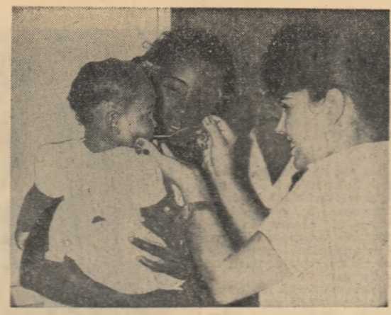
În Cuba se duce în prezent o vastă campanie pentru vaccinarea antipoliomielitică. În fotografie un aspect de la un centru de vaccinare antipoliomielitică.

MOSCOVA (Agerpres) TASS transmite: Organele de spionaj americane au fost demascate din nou de către doi cetățeni sovietici în cadrul unei mari conferințe de presă care a avut loc la 18 aprilie la Moscova. Deschizând conferința de presă, Alexei Popov, șef interimar al secției de presă a Ministerului Afacerilor Externe al U.R.S.S., a prezentat celor 300 de ziariști sovietici și străini pe Alexei Golub și Nikolai Vohmeakov care în cursul unei călătorii turistice în străinătate au hotărât să rămână în afara hotarelor U.R.S.S. și au început pe milie spionajul U.S.A. Sîmțind pe propria lor piele „plăcerile” lumii capitaliste, fugarii au fost repede dezamăgiți și s-au înapoiat în patrie. Într-o declarație făcută la conferința de presă, reprezentantul Ministerului Afacerilor Externe al U.R.S.S. a zămbit despre campania antisovietică zgometoasă pe care ziarile burgheze au desfășurat-o în jurul cazului Golub pentru a defăima Uniunea Sovietică.