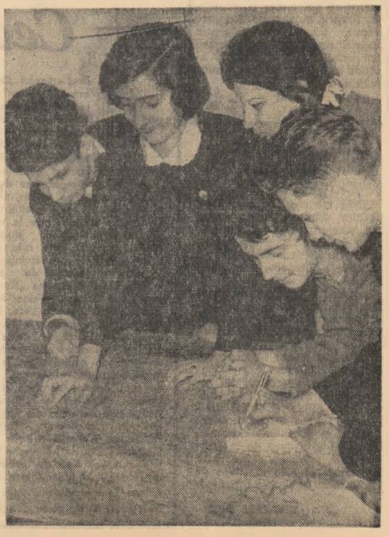
Elevii ai Școlii medii nr. 1 din Sibiu stabilind pe hartă itinerariul unei noi excursii.

Un rol important în bunul mers la învățătură îl au și grupele de întrautoare care s-au format în școala noastră.