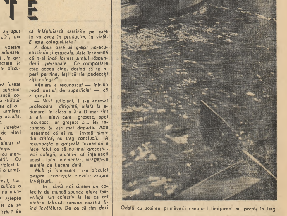
Odelă cu sosirea primăverii canotorii limisoreni au pornit în larg.