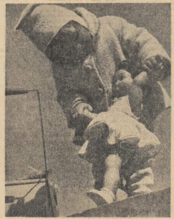
Cei mici, și cei... mari

Floare de cicoare Plimbă-mi-se plimbă, Dimineața-n zori, Cine mi se plimbă? O tinărată Tot îmbujorată Cu roua-n picioare — Floare de cicoare Cătă după soare... Cînd prinde să treacă Holda i se-aleacă, Cînd dă ea cu pasul I se aude glasul: D-alcă plînă-alcă Holda nu-s miel. Kehlepe vin Se oprese puțin Secera începe Oamenii fac cete, Floare de cicoare Fată din ogoare Cătă după soare... Toamna de-a veni S-o căsători; La nunta ei Vor juca flăcăi, Cîntări ei vor zice — Crescute-ntr-o spice: — Floare de cicoare — Crescută-n ogoare N-are-asemănare! Zile-muncă multe, Mai mult de trei sute! Mînuțele ei Cotul secerii, Ochisorii ei Cimpul cu cirstel.