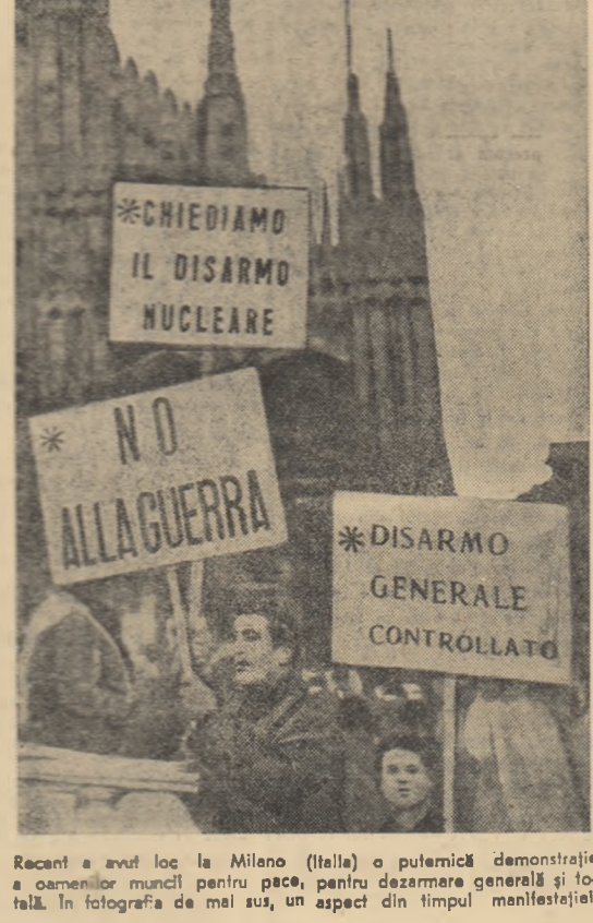
Recent a avut loc la Milano (Italia) o puternică demonstrație a oamenilor muncii pentru pace, pentru dezarmarea generală și totală. În fotografia de mai sus, un aspect din timpul manifestației.

Creșterea permanentă a numărului de șomeri, datorită stagnării în economie, scrie ziarul „Ashkan”, amenință economia țării noastre. Șomajul a atins un nivel extrem de ridicat.