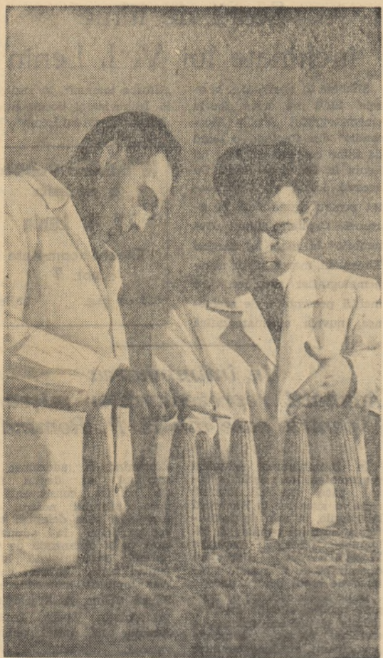
Examinând hibridul dublu de porumb creșt la Centrul de cercetări de la Fundulea