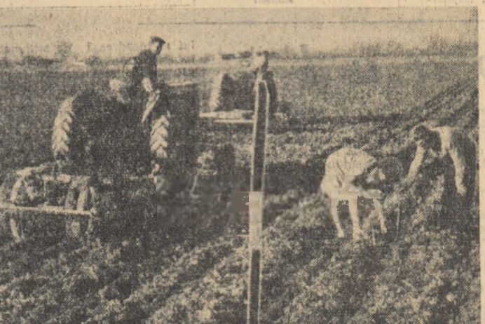
— În Oltenia s-au însămînțat cu porumb mai mult de jumătate din terenurile rezervate acestei culturi. O dată cu semănatul porumbului colectivității însămînțează între rînduri fasole. Suprafața semănată în acest fel este de 3 ori mai mare decît anul trecut.

Sprînjini de mecanizatori de la S.M.T. Ulmu-leț, colectivității din raionul Zimnicea, regiunea București, au terminat marți primii din regiune, semănatul porumbului, pe cele aproape 21.000 de hectare prevăzute pentru această primăvară.