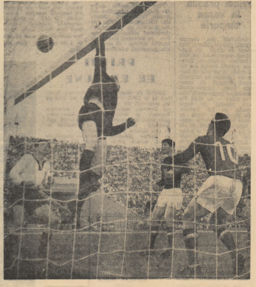
Un nou atac inspirat al juniorilor noștri. Portarul formației R. F. Germane se ivește în ultima instanță în corner.