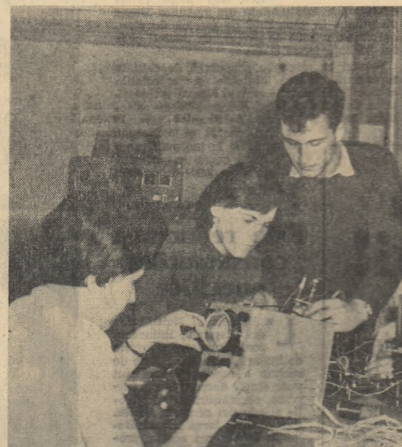
În laboratorul de radio-electronică, în feța aparatelor, studenții anului II al Facultății de fizică chimie din cadrul Institutului pedagogic de țară au învățat să completeze cunoștințele predate de la orele de curs.