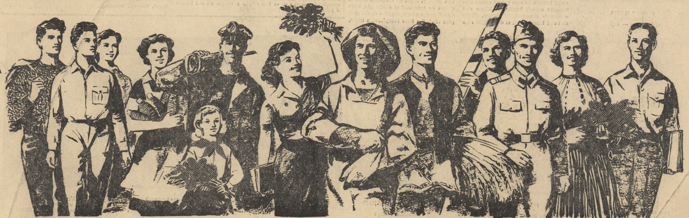
Desen de P. NAZARIE

Tu ne-ai dat întîia dimineață, Soare-al vieții noastre, scump Partid! Comunismul ni-l aduci în față — Toate diminețile din viață Poarta de lumină și-o deschid.