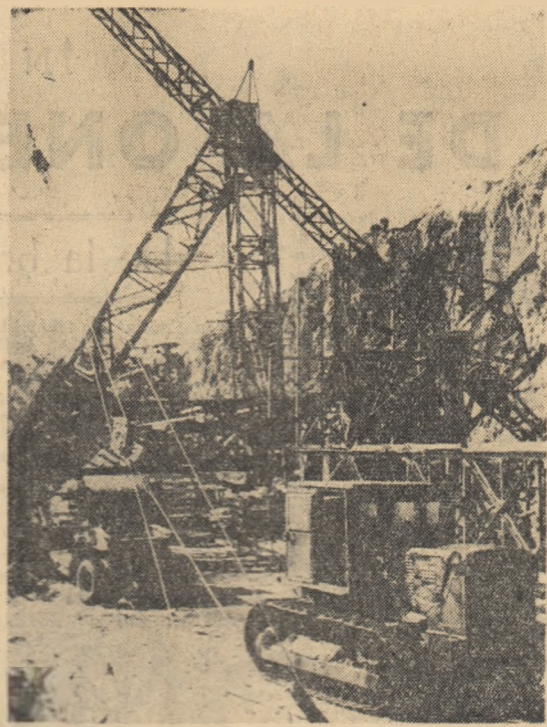
Aspect de pe șantiierul de construcție al urășii hidrocentrale de la Krasnoarsk din U.R.S.S.

Dezarmarea are o însemnătate vitală, a spus în cuvântul său primul ministru, și se trebuie să se facă totul pentru a evita izbucnirea războiului nuclear. Nehra a declarat că este conștient de faptul că dezarmarea este o problemă vitală și că trebuie să se facă totul pentru a evita izbucnirea războiului nuclear.