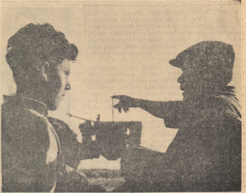
Scurt popas în amurg! Despre ce discută tatăl și fiul în aceste clipe de răgaz? Despre lucrările pe care le-au efectuat pe întinsele ogăre ale întregii gospodării colective...