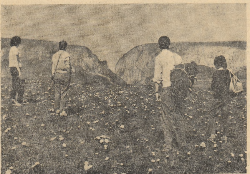
Spre Cheile Turzii