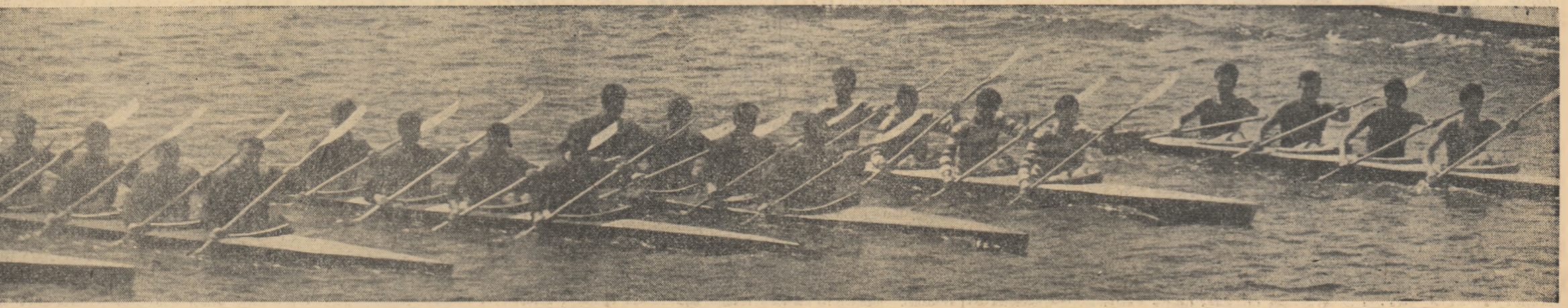
Într-o perfectă sincronizare canotorii stîmesc ropote de aplauze. (Aspect din finala întrecerilor de canotaj, desfășurate duminică în Percul Herăstrău în cadrul serbarii tineretului).

ILARIA CHIPIMIA (Continuare în pag. a 3-a)