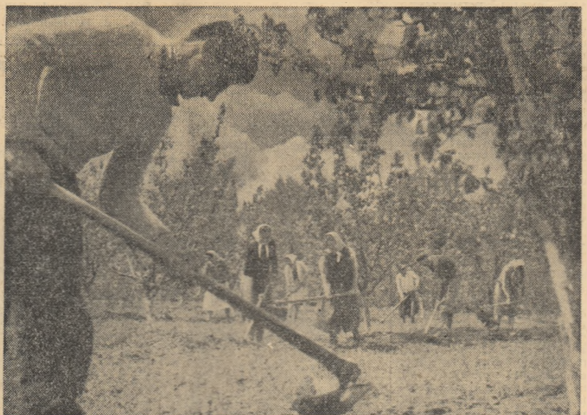
În aceste zile frumoase de primăvară, lucrări de întretinere a livezilor la Combinatul agro-alimentar „30 Decembrie”.