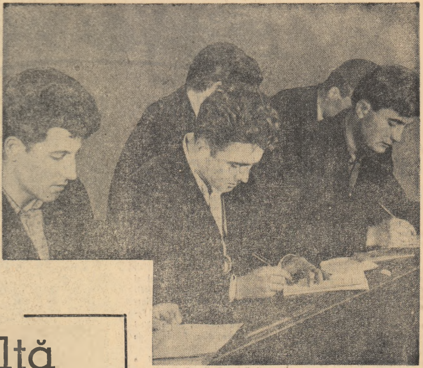
Îmbogățirea conținutului a cunoștințelor tehnice constituie una din preocupările de seamă ale tinerilor strungari de la Uzina „Electropulbere” din Craiova. Mobilizați de organizația U.T.M., ei participă în număr mare la cursurile de ridicare a calificării profesionale organizate în uzină. Iată un aspect de la unul din aceste cursuri.