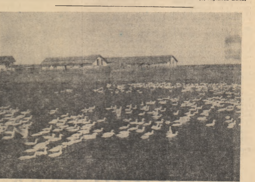
Colectivul din comuna Vădeni, raionul Brașov, are peste 1.000 de rețe mătăc din care vor obține anul acesta 15.000 de boboci. În fotografie: aspect din „rețu” păsărilor de bătă.