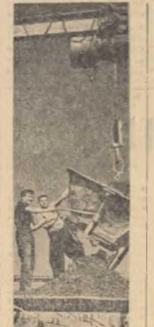
Întreprinderea de prefabricate și elemente de construcții Brașov. Aici se fabrică stâlpi de beton precomprimat pentru electricitate.