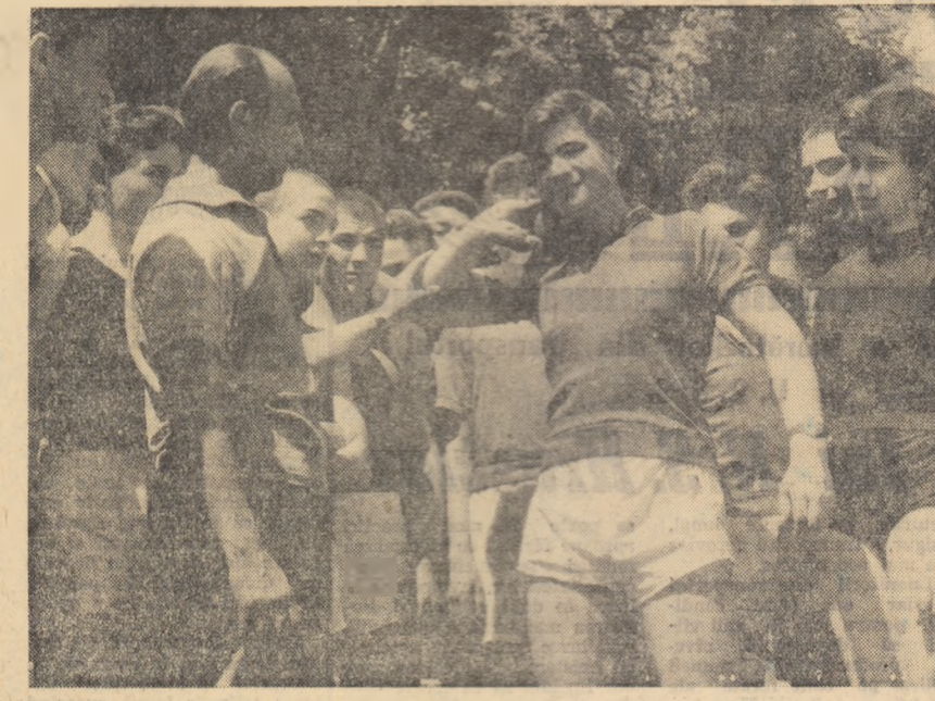
Oră de educație fizică la Școala medie nr. 1 din Arad.

În laboratorul de încercări chimice de la Fabrica de țevi din Roman, se determină conținutul de calcar din apa necesară răcirii agregatelor.