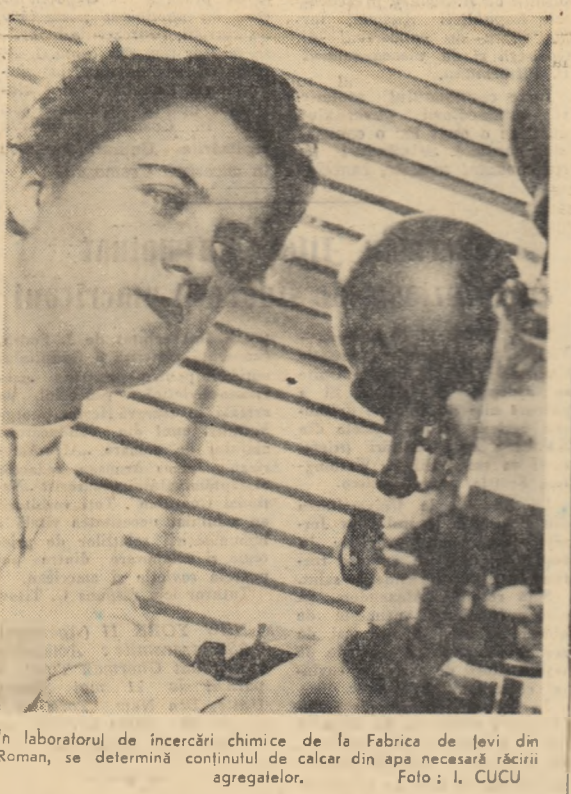
În laboratorul de încercări chimice de la Fabrica de țevi din Roman, se determină conținutul de calcar din apa necesară răcirii agregatelor.